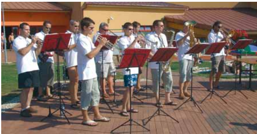
VÍZI ZENE SZÓLT A VÍZ PARTJÁN A FÚVÓSOK JÓVOLTÁBÓL