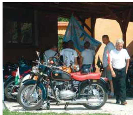
A VETERÁN MOTOROK SZERELMESEI IS TALÁLHATK MAGUKNAK LÁTNIVALÓT