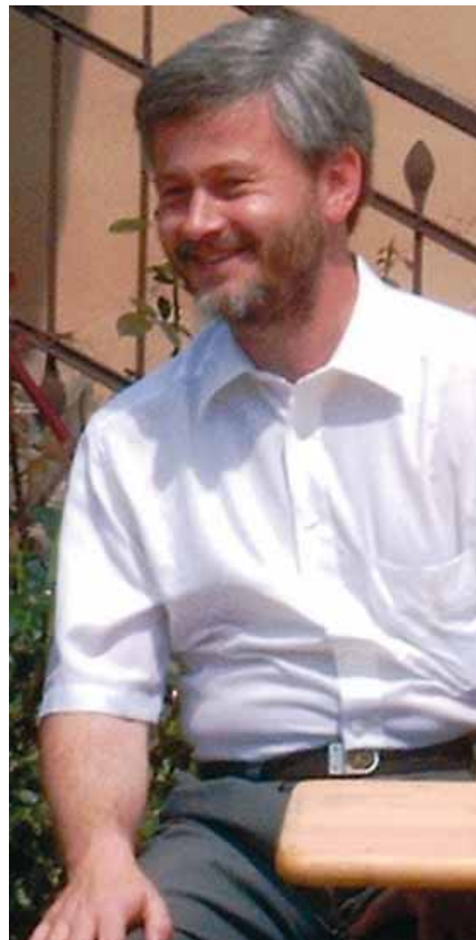
A 2007-ES GYÜLEKEZETÉPÍTŐ NAPON

– Nagyon sok. A gyülekezet tagjainak legnagyobb panasza ellenem, hogy nem látogatok. A panasz így nem helyes, ezt korrigálnám. Mert látogatok, de azok hiányolják ezt, ahova 17 év alatt nem jutottam el, vagy nem akkor, amikor ők azt szerették volna. Úgy vélem, nem az volt a baj, hogy sok feladatom volt, hanem az, hogy sok olyant kellett ellátnom, ami nem az én dolgom. A pénztár kezelésének szerveázó munkája, adóbevallások, nyugdíjjárukbévallások, számlák és így tovább. A pénztár átadásakor egy idő után az új pénztáros időt kért, hogy ezt már neki írnia kell. A fő probléma szerintem az, amit nem tudatosítottak magukban a híveim. A délelőttök elmennek a hittanórai készüléssel, majd következnek a hittanórák, amikben én sokkal jobban elfáradok, mint egy „harc-