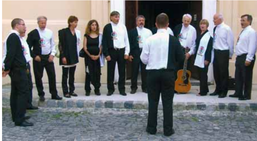
A RAIMONDO MONTECUCCOLI KÓRUS A TEMPLOM ELŐTT