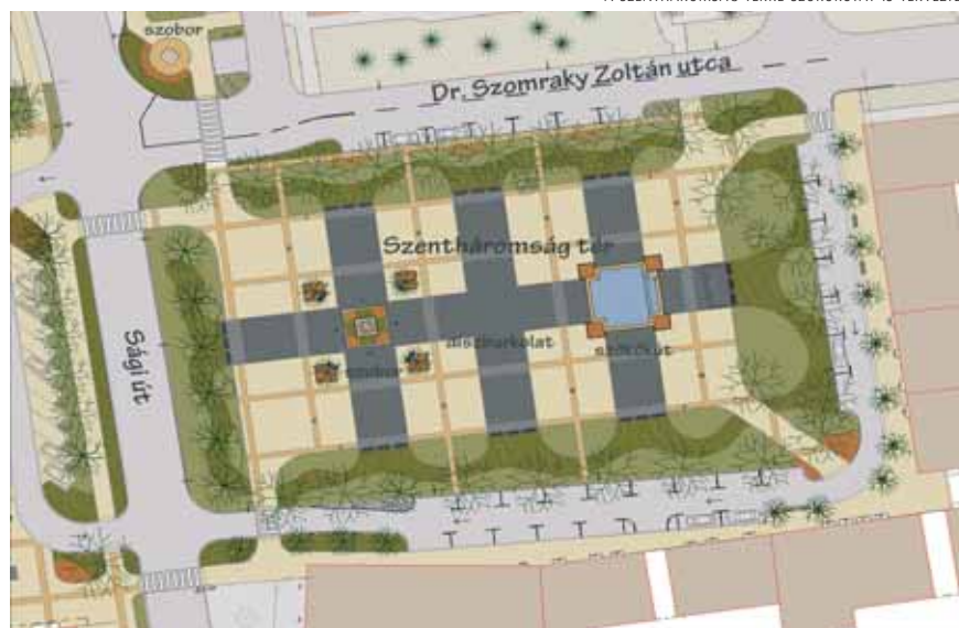
A SZENTHÁROMSÁG TÉRRE SZÖKŐKUTAT IS TERVEZTEK