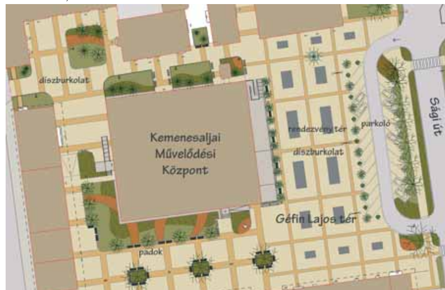
A DR. GÉFIN TÉR ÚJ DÍSZBURKOLATOT KAP

A Szentháromság szobor padozatba rejtett díszvilágítást kap. A szobor körüli zöldfelület megnövekszik és a szobor köré négy új fa is kerül. A tervezett új szökőkút alkotja a Szentháromság szobor mellett a tér második pólusát. A szökőkút számítógép-vezérelte víz- és fényjátékkal ellátott vízgépészettel készül. A vízképet színes alsó világítás emeli ki. A számítógépes vezérlés lehetővé teszi, hogy a szökőkút a meglévő harangjátékkal összehangoltan működjön. A szökőkút peremére kerül a dr. Géfin Lajos téren lévő kétalakos szobor, amely a valamikor ott lévő vízmedence szélén volt. A tér burkolata a posta előtt alkalmazott sárgásbarna térkő burkolat, melyet a kegytemplom és a polgármesteri hivatal előtt alkalmazott bazalt csíkok tagolnak. A burkolt felületet négy oldalon alacsony cserjékkel, talajtakarókkal, egynyári növényekkel és kevés gyeppel fedett intenzíven kiültetett zöldfelület határolja.