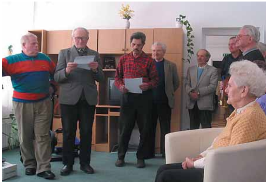
FEOLVASÓ EST AZ IDŐSEKNÉL

délyt. Az ide felvételt nyertek kellemes környezetet, jó társaságot és mint a többi helyen is, megfelelő gondoskodást, szerető légkört kapnak. Ebben az évben (2006) elindult ezen a területen is a kistérségi összefogás.