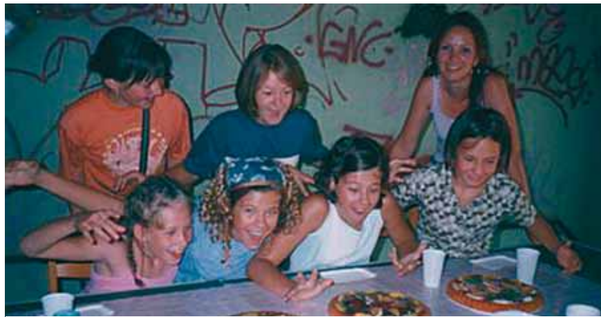
A GYERMEKJÓLÉTI SZOLGÁLAT MINDEN ÉVBEN TÁBOROZNI VISZI A GYEREKEKET