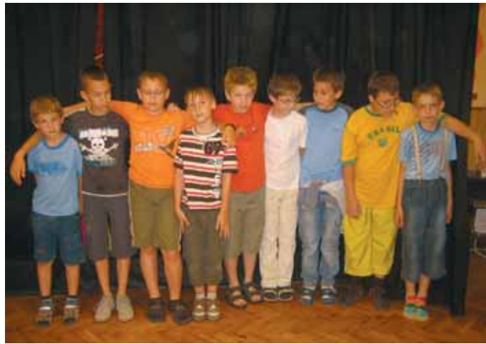
AZ ARANY MINŐSÍTÉST NYERT CSOPORT

és a versenydarabot vegyes technikával. Ez utóbbi címe: Csipike, a boldog óriás . A főszereplője egy törpe, aki boldogtalan a törpesége miatt. Örömmel elfogadja bagoly doktortól a varázsport, amitől óriásira nő. De hiába nőtt meg, nagyon magányossá vált, ezért szétszórta a varázsport a négy égtáj felé: megnövesztette a világot, s így helyreállt a régi rend. Visszatért a barátaihoz és ismét boldogan élt törpeként is. Ebben a darabban a színészi játék mellett a díszletmozgatásnak is fontos szerep jutott. A látvány és a játékosok alakítása együtt juttatta a katarzis élményéhez a nézőket.