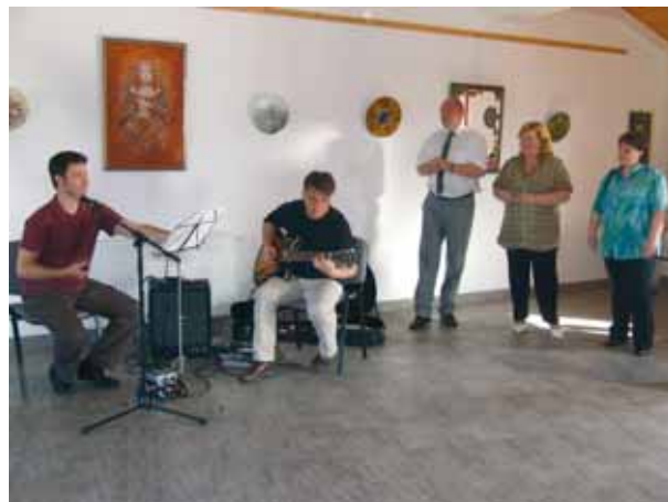
A KIÁLLÍTÁSMEGNYITÓ RÉSZTVEVŐI