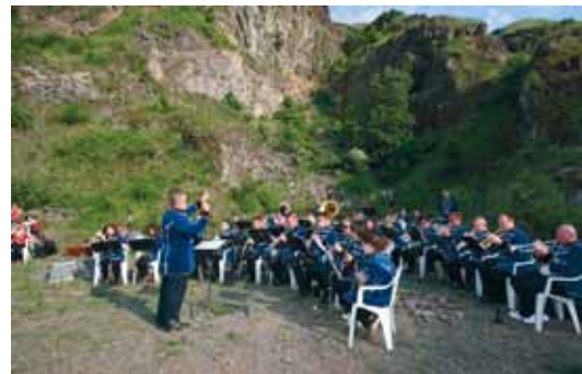
BEMUTATKOZTAK A VERESEGYHÁZI FÚVÓSOK IS