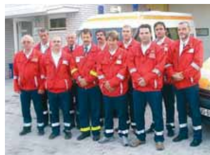
A GYŐZTES HELYI MENTŐSÖK CSAPATA

nen 2007 áprilisában költözhettek be az immáron a kor igényeinek megfelelő, modern épületbe közvetlenül a helyi kórház épülete mellé az orvosi ügyelettel együtt. Az ellátási körzetükben több mint harmincezer ember él. A szavazás idején az állomás létszáma tizenhárom fő volt.