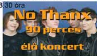
No Thank 90 perces élő koncert

9.00 óra „Fut a Cell” 16.00 óra Ökorsütés (kóstolás a szűrésen résztvevőknek ingyenes!) 18.00 óra SORSOLÁS 18.30 óra