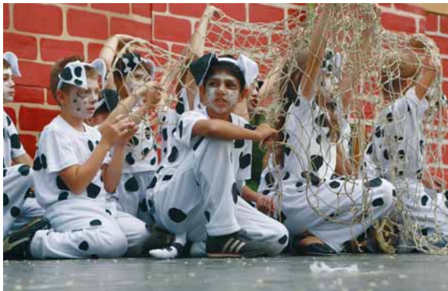
AZ ALSÓSÁGI TAGISKOLA TANULÓINAK EGY CSOPORTJA

Az elmúlt évekhez hasonlóan idén is megrendezte a Kemenesaljai Művelődési Központ és Könyvtár az alsósági részönkormányzattal karöltve a városrészen a tavaszi napokat. A május 15. és 17. között zajlott Alsósági Tavaszi Napok programsorozata ünnepélyes megnyitóval vette kezdetét, melynek keretében Fehér László polgár-