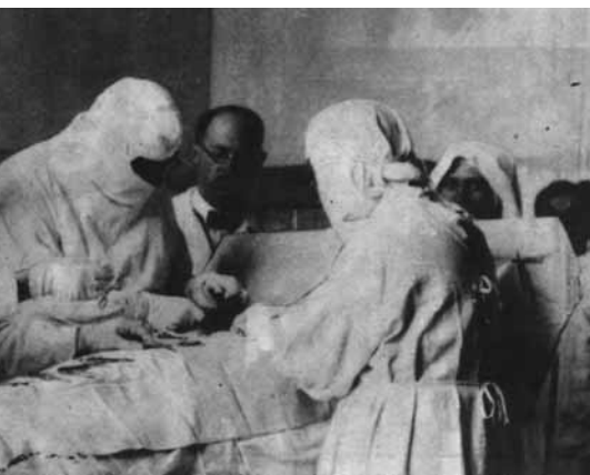
MŰTÉTI FELVÉTEL A 30-AS ÉVEKBŐL

Ha az érdeklődő olvasó kezébe veszi Az egészségügy története című, 1996-ban megjelent könyvet, mely nagy körtekintéssel, részletesen dolgozta fel a témát, egy következtetést biztosan le fog vonni. Nevezetesen azt, hogy napjaink gondja nem új ke-