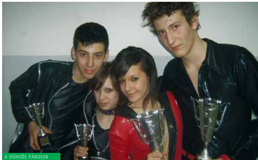
A DÖNTŐS PÁROSOK