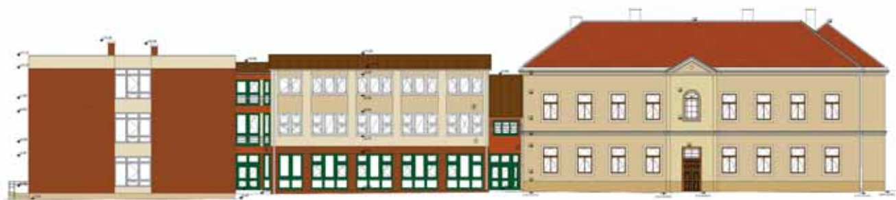
A CELLI ISKOLARÉSZ ÚJ ÉPÜLETÉNEK HOMLOKZATI RAJZA A SZÉCHENYI UTCA FELŐL

A fejlesztések három csoportra oszthatóak, az első körbe a funkcionális változtatások tartoznak, ezek minden épületet érintenek. Jelenleg csak példálódzó felsorolással a celli részen a következő gondok várnak megoldásra e körben: nem megfelelő jelenleg sok tanterem mérete, a kis tantermek zsúfoltak, a tanulók számára mozgáslehetőséget nem nyújtanak. Az intézményben nincs kellő számú, az előírásoknak megfelelően kialakított szaktanterem, nincs megfelelő olvasóteremmel ellátott könyvtár, nincs megfelelő közösségi tér, nehézkes az épületek közötti átjárás, a nevelői szobák is szétszórva helyezkednek el. Az egyéni fejlesztés és az integrált oktatás infrastrukturális feltételei, eszközei sem állnak rendelkezésre. Az alsósági épületekre is igaz a fentiekből jó néhány tétel, itt például három szükség-tanteremben is oktatnak ma még, az órarend tervezését a teremhasználat lehetőségei és nem a szakmai szempontok határozzák meg. A leglátványosabb változás Cellben az a több mint 1000 m 2 -es új épület fogja jelenteni, ami a Gáyer felsős épület előtti kavicsos területen a Széchenyi utcával párhuzamosan fog épülni. Ez, amellett, hogy a meglévő tornatermi folyosó mellett az épületek új, akadálymen-