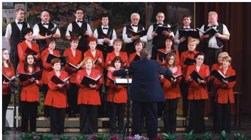
A MŰSOR A CELLDÖMÖLKI LISZT FERENC VEGYESKAR FELLÉPÉSÉVEL KEZDŐDÖTT