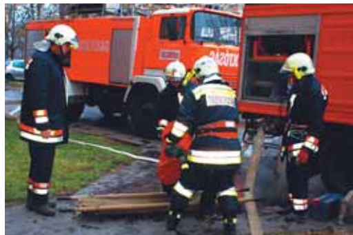
GYAKORLAT KÖZBEN A TŰZOLTÓK

Hogy ezt a gyakorlatban is bizonyítsák, november végén közös gyakorlatot tartott a két állomány az egyik tizenegy emeletes épületben. Ennek az volt a fő oka, hogy – szerencsére – ebben az évben kevés riasztása volt az egyesületnek. A szimuláció so-