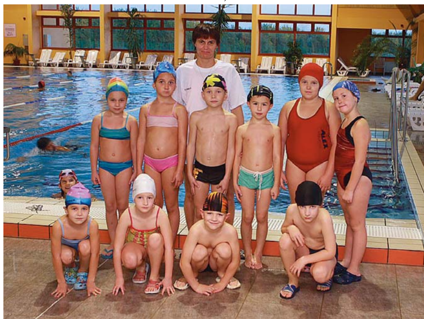
A CELLDÖMÖLKI VULKÁN VÍZISPORT EGYESÜLET EGYIK CSOPORTJA