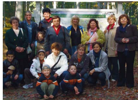
A RÉSZTVEVŐK EGY CSOPORJA A HÉTFORRÁSNÁL

A Rákellenes Liga celldömölki tagszervezete idén januárban a gimnáziumban tartott előadást a HPV-vírus elleni védőoltásról, márciusban nőnapra ünnepséget szervezett, és különböző előadásokat tartottak gyógyhatású készítményekről, az egészséges táplálkozásról, fájdalomcsillapításról. Jövő hónapra előadást terveznek a gégerákról, amelyet szűrővizsgálat fog kiegészíteni. Tavaly a Kis-Balatonon voltak kirándulni, amely mindenki számára nagy élmény volt, arra gondoltak, hogy idén ezt jó lenne megismételni, hiszen betegek, gyógyultak, hozzátartozók együttesen tölthetnek el egy kellemes napot. Egyik idei őszi programjuk a Lánchídi Séta mintájára a Hétforrás-séta, ami egy kb. 5 kilométeres táv volt, másik hasonló program pedig a Velemi Gesztenyeünnepen eltöltött idő, mely a jókedv, a kikapcsolódás jegyében telt.