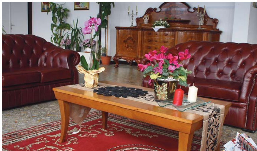
A VASVIRÁG SZÁLLÓ TÁRSALGÓJA

– Bizony kell. Ezért igyekszünk a város, a Ság hegy, a Vulkán fürdő legvonzóbb vendégcsalogató látványosságait prospektusokon, internetes portálokon hirdetni. De kihasználjuk azt is, hogy a város sok sportlétesítménnyel rendelkezik, ehhez kapcsolódva edzőtáborokhoz, nyári táborokhoz kínálunk lehetőséget. Mindig hangsúlyozzuk a kistérségi látnivalókat is, többek között környezetünk irodalmi em-