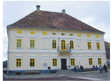
A SOKAT MEGÉLT RHÉDEY-KASTÉLY

A templom építési ideje nem ismeretes, valószínű a XIV. sz. első évtizedeiben épült és Szent György tiszteletére szentelték fel. Külső fala a védőszentjéről készült falfestmény nyomait őrzi, bent látható Rhédey Claudia emléktáblája, melyet Mária angol királynő adományából helyeztek oda 1936-ban. A katolikus falu a reformáció idején az unitárius vallásnál állapodik meg, majd 1640-ben újra a reformátusoké lesz. A templom alatt kriptá is van, melyet az 1614-es dögvész idején fejedelmi rendeletre befalaznak. Erdőszentgyörgy nevezetes épülete a Rhédey család későbarokk díszítésű kastélya. A Rhédey család révén Erdőszentgyörgy hírneve messze túlnő a falu és az ország határára. Az erdőszentgyörgyi Kornis birtokot Bethlen Gábor fejedelem adományozza a Rhédey családnak. Az új kas-