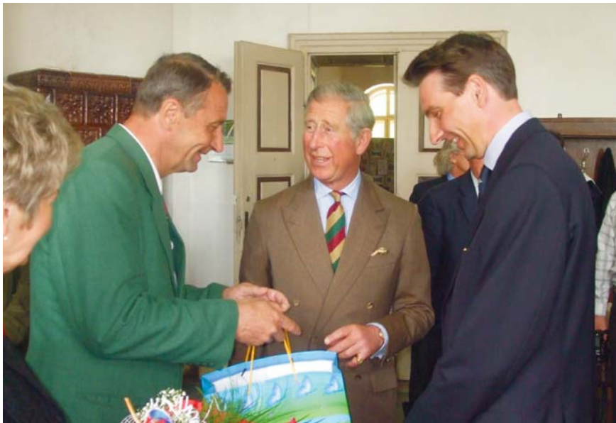
CHARLES BRIT TRÓNÖRÖKÖS ERDŐSZENTGYÖRGYI LÁTOGATÁSÁKOR AJÁNDÉKOT AD ÁT TAR ANDRÁSNAK, A VÁROS POLGÁRMESTERÉNEK

múltra tekint vissza. Erdőszentgyörgy az ősrégi települések közé sorolható, hiszen határában bronz- és vaskori régészeti leleteket tártak fel. A község nevét az erdő koszorúzta helyről és Szent György tiszteletére felszentelt templomáról kapta, így viseli az Erdőszentgyörgy nevet. Az első írott emlék a településről 1333-ból származik. A közoktatás intézményesített formája már 1626-ban jelentkezik. Erdőszentgyörgy műemlékei közül a református templom – az egykori római katolikus templom – letagadhatatlan bizonyítéka annak, hogy az itt élő magyarság