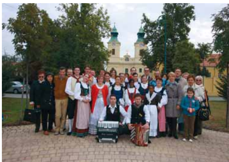
A PAGNACCOI MŰVÉSZETI CSOPORTOK