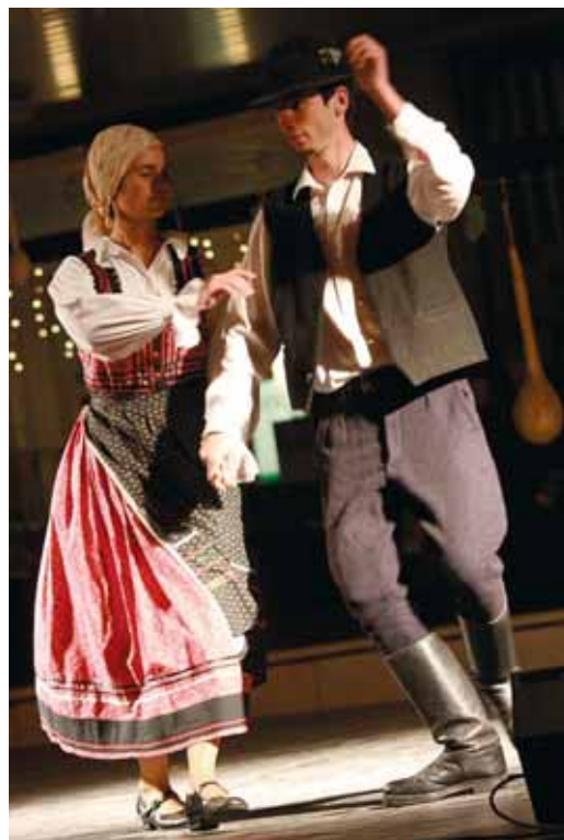
ÉRTÉKES PRODUKCIÓT LÁTHATTUNK A BÍBORKA NÉPTÁNCGYÜTTES ELŐADÁSÁBAN