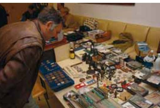
AZ ÉRDEKLŐDŐK KÍVÁNCSIAN SZEMLÉLIK A PÁRATLAN KINCSEKET

Nyolcadik alkalommal került megrendezésre városunkban a Ki mit gyűjt-találkozó. A rendezvényen fém- és papírpénzek, régi órák, könyvek, különböző korszakokból származó kitüntetések, korabeli fegyverek és még sok más különlegesség cserélt gazdát.