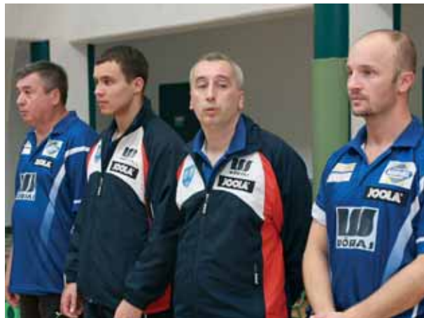
A CVSE-MÁVÉPCCELL-VÖRÖSÁS CSAPATA

Floymapa Cartagena (spanyol) – SC Nord Doneck (ukrán) 1:3.