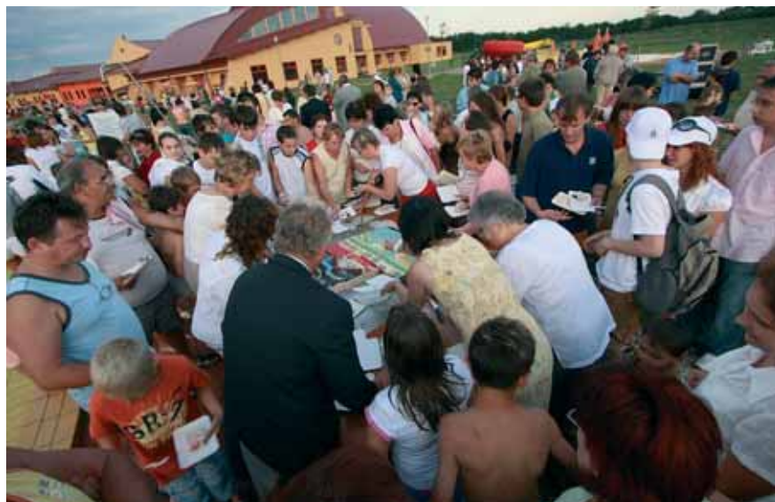
TORTÁVAL ÜNNEPELT NÉPES KÖZÖNSÉG

Augusztus 20-án a délelőtti emelkedett hangulatú ünnepséget a Vulkán Gyógy- és Élményfürdőben megtartott könnyedebb hangvételű műsor követte. Ekkor került sor a fürdő születésnapjának megünneplésére is. Imár három éve annak, hogy a Vulkán Gyógy- és Élményfürdő megnyitotta kapuit a vendégek előtt. A harmadik születésnap megünneplésére családi délutánt szerveztek,