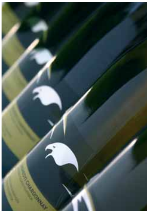
MINŐSÉGI BOR MINŐSÉGI CSOMAGOLÁSBAN

– A hegybirtok gondolata egyik pillanatról a másikra pattant ki a fejemből: az önálló borkészítésben akarom próbára tenni magam! Három év távlatából visszatekintve ma már egyértelműen sorsszerűnek tartom ezt a döntésemet. 2005-ben vásároltam meg az első szőlőterületeket és ma is úgy gondolom, helyes volt elindulni az ötlet megvalósításával. Sokat tanulhattam és tapasztalhattam egy új szakmából, életstílusról és nem utolsósorban önismeretből. Miért a Ság hegy? Ez igencsak természetes, magától értetődő volt. Ide vonzóztak vissza a családi gyökerek, a gyerekkor szép emlékei sok-sok megélt szüretéről és egy