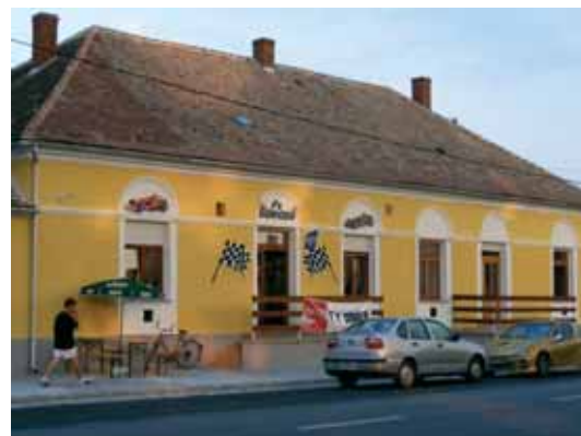
AZ F1-ES SÖRÖZŐ MŰKÖDIK A MEGÚJULT ÉPÜLETBEN

ző megtoldására, ezáltal minden igényt kielégítő módon fogadhatják majd a sportolókat. A tervek már készen vannak, a megvalósítást mielőbb szeretnék