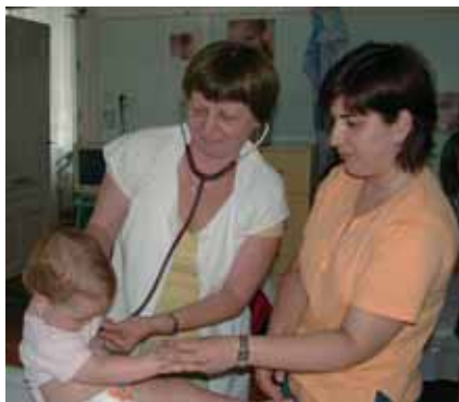
MUNKA KÖZBEN A DOKTORNŐ