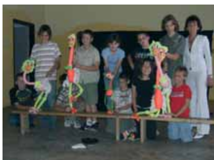
A BÁBCSOPORT TAGJAI: