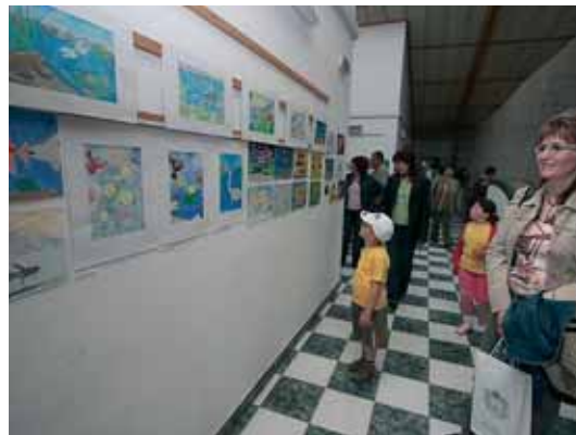
SZÍNVIONALAS KIÁLLÍTÁS KÉSZÜLT A GYERMEKRAJZOKBÓL