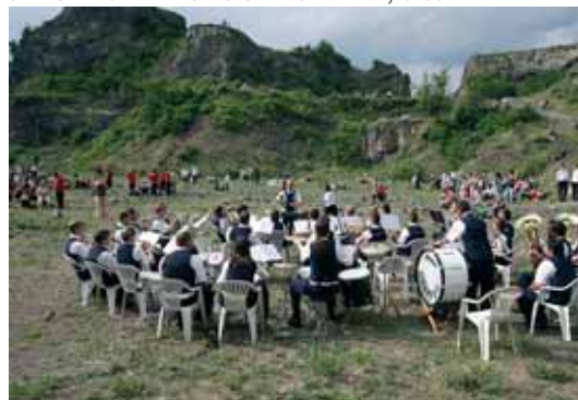
A KRÁTER-HANGVERSENY SZEREPLŐI ÉS KÖZÖNSÉGE