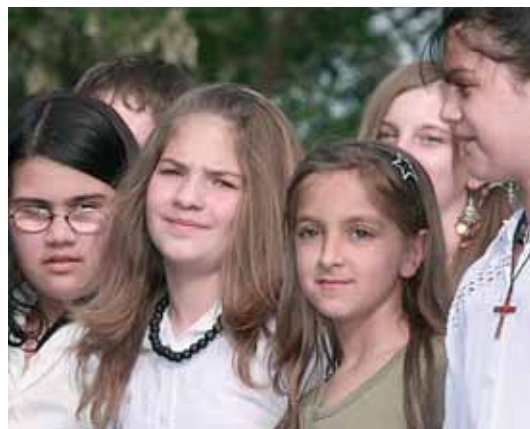
AZ ALSÓSÁGI TAGISKOLA KÓRUSA NYITTA A RENDEZVÉNYT