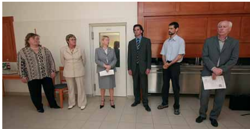
AZ ADO MÁNYOZÓK ÉS ADO MÁNYOZOTTAK