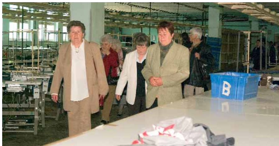
NOSZTALGIA-SÉTA A RÉGI ÜZEMEN

(A fényképek megrendelhetőek a művelődési központ portáján – elnézést a határidő csúszásért. Ugyancsak szép emlék lehet az elkészült videó-anyag is, melyet CD-n nálam lehet kérni).