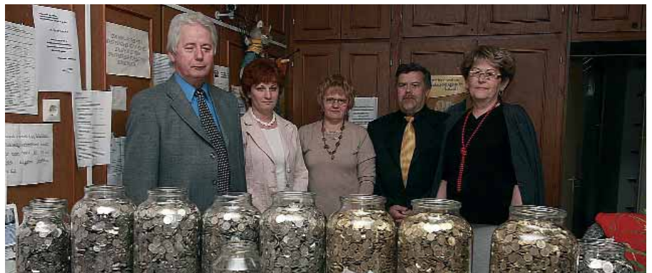
AZ ADOMÁNYOZÓK ÉS A KÓRHÁZ ALAPÍTVÁNYÁNAK ELNÖKE AZ ADOMÁNNYAL