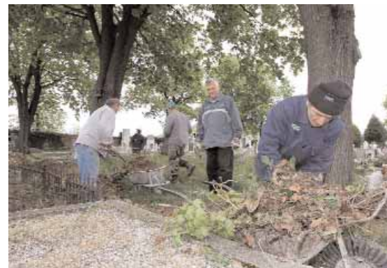
NAGYTAKARÍTÁS A CELLDÖMÖLKI TEMETŐBEN

Élénk munka folyik az Együtt Celldömölki Városért Egyesületben. Az elmúlt időszakban „tavaszi nagytakarítást” tartottak a város lakóival és az egyházakkal karöltve a város temetőiben. Ezzel azonban a feladat nem ért véget: az egyesület az idősekre gondolva hamarosan padokat és műanyag öntözőkanonákat helyez el a temetőikben. Kéri a lakosságot továbbá, hogy a szemetet a hulladékgyűjtőbe helyezze!