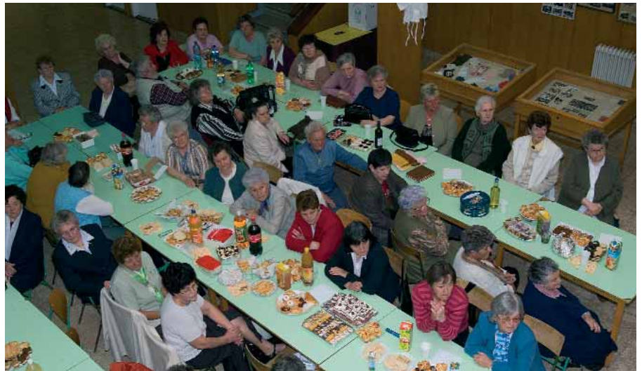
A TALÁLKOZÓ RÉSZTVEVŐINEK EGY CSOPORTJA

Kis csodára vártunk, hogy meglátjuk egykori önmagunkat a portánál belépve/kilépve műszakváltáskor, az öltözőkben, a gépek mellett, az ebédlőben, ahol sohasem volt elég jó a kaja. Emlékezni a nyolcórás, bizony kemény műszakra, a folyton szigorodó normákra, az új termékekre, amit a mi technológusaink fejlesztettek ki.