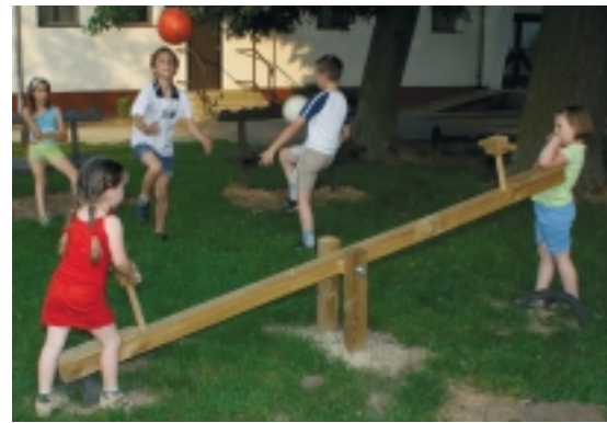
AZ IZSÁKFAI GYEREKEK JÁTSZÓTERET KAPTAK

engem. Ezt sérelmesnek tartom, hiszen az alpolgármester jelölése az én jogom, hiszen nekem kell együtt dolgoznom a helyettesemmel. Jó jel vi-