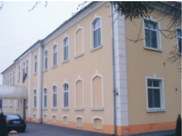
MEGMARADT A KEMENESALJA KÓRHÁZA

komoly tárgyalások folynak, s reményeink szerint egy éven belül megindul ott az építkezés. Elkészült a megvalósíthatósági tanulmány a Ság hegy alatti egykori raktártelep területén tervezett kalandparkra, és a tervek között van a Ság hegyen a Vulkán Park kialakítása, ezt a két elemet együtt