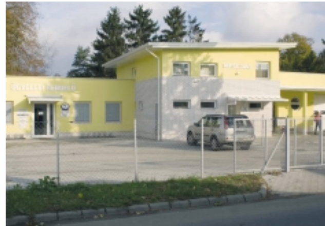
TAVASSZAL ADTÁK ÁT A MENTŐÁLLOMÁST

– Polgármesterként szeretnék partnerként dolgozni a képviselő-testülettel. Az előző ciklusban ez így is volt, most viszont nem tartom szerencsésnek a felállást. A városháza-építés ügyében látszik igazán, hogy nem tudjuk összehangolni az elképzeléseket. A legsarkalatosabb dolog az ellentétek között azonban az alpolgármester-választás, mivel a testület többsége nem támogat ebben