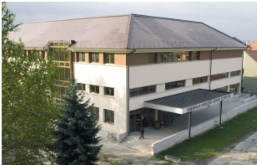
A FELÚJÍTOTT MŰVELŐDÉSI KÖZPONT ÉS KÖNYVTÁR

vagy külön-külön is megvalósíthatjuk. Fontosnak tartom, hogy a fejlesztési elképzelésekhez elkészüljenek a dokumentációk. Elképzelhető, hogy egy-egy projektre nem az első körben nyerünk, de a dokumentáció meglétével bármelyik későbbi pályázaton részt vehetünk. Magántőke bevonásával is megvalósulhatnak a fejlesztések, ezért ezt is a lehetőségek között tartjuk számon. A jelenlegi Nemzeti Fejlesztési Terv után is lehet majd pályázni az Európai Unió fejlesztési ciklusában, biztosan maradnak elképzeléseink, amelyeket nem most, hanem később tudunk majd megvalósítani. Az azonban nem mindegy, hogy melyek valósulnak meg előbb, és melyek maradnak későbbre.