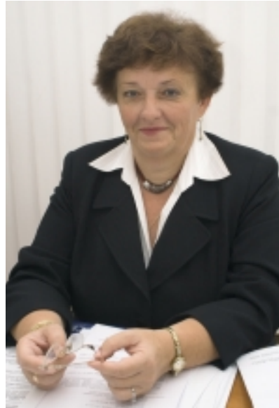
FOTÓ: MAJOR TAMÁS

– Köszönök születtem, Egyházashetyére jártam általános iskolába, innen Szombathelyre kerültem a közgazdasági szakközépiskolába, pénzügyi tagozatra. És noha a matematikával soha nem volt gondom, mégis úgy éreztem, nem tudnám elképzelni az életem a számok között. Engem az emberek érdekelték. Ennek megfelelően jelentkeztem a jogi karra. Gyakornokként Egyházashetyére kerültem a tanácsra, ahol Horváth Laci bácsi segített mindenben. Itt ugyanis az iktatástól az adóügyekig, az igazgatási ügyintézésig mindennel foglalkoznom kellett. Néhány hónap után Kis-somlyóra kerültem VB-titkárként. Ezután Dukára is át kellett járnom helyettesíteni. 1976-ban mentem férjhez, már Celldömölkön laktunk, de 1977 februárjáig innen jártam ki dolgozni, majd bekerültem Celldömölkre, a nagyközségi tanácsra. Ennek épp 30 éve, ebből adódóan az összes közigazgatási átszervezést megéltem. 1979-ben, amikor város lettünk, a nagyközségi tanács titkárságán dolgoztam, ekkor kerültem át a szervezési és jogi osztályra, ahol egy-két éven belül megbízott, majd kinevezett osztályvezető lettem 1989-ig. 1979-ben született az első gyerme-