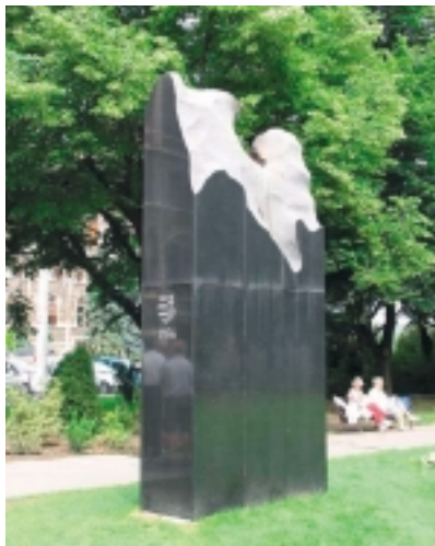
A FORRADALOM LÁNGJA CÍMŰ ALKOTÁS BUDAPESTEN

„1956 októberéről nem lehet nem tudomást venni; olyan ez, mintha egy tárgyalóasztal közepén egy hulla feküdne kiterítve. Egy hulla fölött nem lehet tárgyalni. A hullával valamit tenni kell. A hullát, ha eltemetik, akkor sem lehet meg nem történtté tenni október eseményeit, a következtetéseket le kell belőle vonni.” Így írt Bibó István 1956 novemberében, amikor már az oroszok dirigáltak, és sok ember és az ország sorsa előre eldöntetett. Szigethy Gábor zsákutcás magyar történelemről beszélt az '56-os történelem és Bibó István kapcsán évekkal ezelőtt. Szomorú tény, hogy ez a kijelentése most is érvényes... Zsákutcában vagyunk a tavalyi rendőri intézkedések kétféle megítélésével, és általában a politikai nyilatkozatokkal is. Sokak szerint zsákutcába jutott gazdaságunk, de nemzetközi megítélésünk is. Minden kijelentésnek vannak támogatói és megcáfolói. A legsajnálatosabb tény, hogy a zsákutcából kijutni csak együtt lehetne, de egyre inkább úgy tűnik, hogy ennek az ideje, de még a szándéka sem körvonalazódik... Emlékezzünk inkább Nagy Imrére! A reformpoliti-