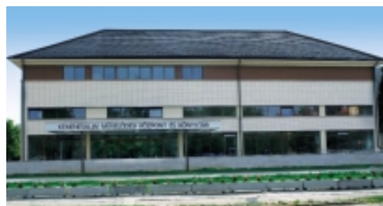
A FELÚJÍTOTT ÉPÜLET

Szakmailag elég nehéz, összetett feladat volt, hiszen egy meglévő épületet kellett a mai igényekhez alakítani és bővíteni. Sokat segített, hogy már vettem részt könyvtári beruházás tervezésében és segítettek a használók is a funkciók pontos meghatározásával. Megkötötte a kezünket az anyagi lehetőségek szűkössége és döntő befolyással volt, főleg a külső megjelenésben az eredeti tervező véleménye is. Mindennek ellenére a lehetőségekhez