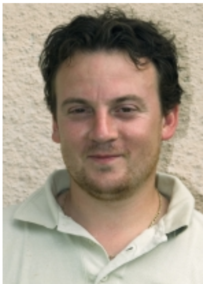
MAJSA SZILÁRD TULAJDONOS

– Mindenképpen kinőtte magát az a kis alapterületű egység. Először is bérlemény volt, a bérlési díj összege is arra ösztönözte, hogy előbb-utóbb saját