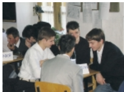
A CELLDÖMÖLKI CSAPAT

Másnap vetélkedő: fiaink becsülettel helytállnak, négy csapat indul, három helyi és a celliek: négyből negyedik.