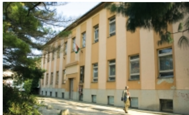
»HP GÁYER GYULA ÁLTALÁNOS ISKOLA

Nagyon szeretnénk, ha zökkenőmentes lenne a következő tanév, ezen dolgozunk, hogy a gyerekek a jövőben is olyan feltételek mellett dolgozzanak, amelyeket eddig megszoktak.