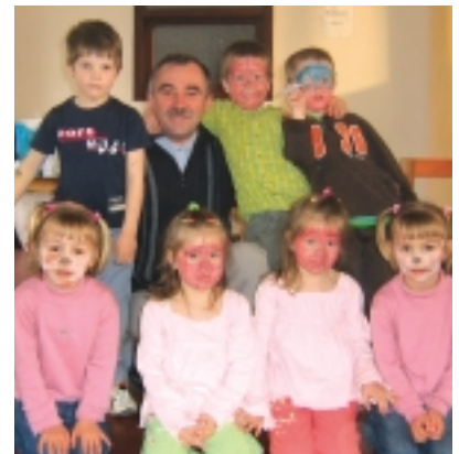
A TOKORCSI GYEREKEK

Április elsején (ez nem tréfa) újra összejött Tokorcs fiatalága, akiket édességgel megrakott húsvéti kosárka várt már. Most a húsvétra való készülés volt a tavaszi nap apropója. A Vöröskereszt Alapszervezetének tag-