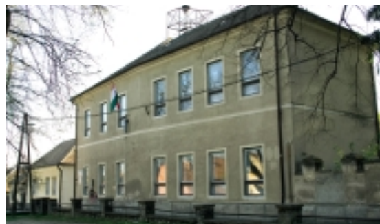
BERZSÉNYI LÉNÁRD ÁLTALÁNOS ISKOLA

– Ez azért fontos és sürgős, mert ez határozza meg, hogy hány pedagógus további foglalkoztatására van szükség. A mostani elgondolásunk szerint a jelenlegi pedagógus-létszámot csak kis mértékben fogja érinteni, de ezt a kérdést mindenképpen pontosítani kell. Bonyolítja a