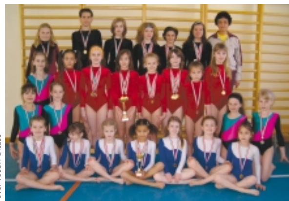
A SZENT BENEDEK KATOLIKUS ÁLTALÁNOS ISKOLA DÍJAZOTT TORNÁSZLÁNYAI