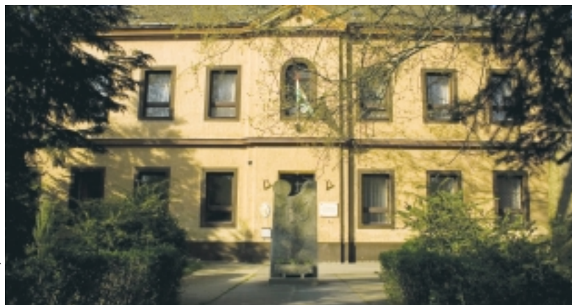
EÖTVÖS LORÁND ÁLTALÁNOS ISKOLA

Bár nagyon fontos kérdés, hogy gazdaságilag ez mennyire előnyös a költségvetés szempontjából, de ez inkább csak másodlagos kérdés. Már évek óta vitatéma volt az Eötvös és a Gáyer iskola összevonása, részben azért, mert közvetlenül egymás mellett helyezkednek el. Most úgy néz ki, hogy ez az iskolák integrációja során realizálódni fog. Természetesen ennek vannak előnyei és hátrányai is. A versenyhelyezet így a két iskola között megszűnik, de nagyon reméljük, hogy az arculatuk megmarad, és talán egymásra épülve erősítik a nevelői-oktatói munka minőségét. Nyilvánvaló, hogy egy kisebb intézményt könnyebb igazgatni, és a szakmai munka is talán hatásosabb, de az élet rákényszerít minket arra, hogy szorosabbra húzzuk a nadrágszíjat, és ezt a lépést megtegyük. Nagyon bízom benne, hogy a tanulói létszám növekedésével nem csökken az oktatás színvo-