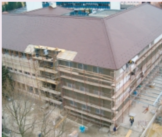
A MEGÚJULÓ ÉPÜLET