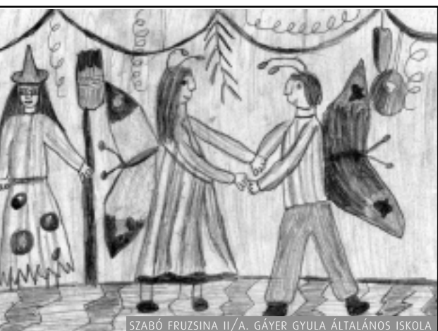
SZABÓ FRUZZINA II./A. GÁYER GYULA ÁLTALÁNOS ISKOLA