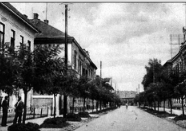
A VALAMIKORI KOSSUTH UTCA

A szövetséges hatalmak 1945. február 4–11. között lebonyolított krími konferenciáján összehangolt hadászati tervek értelmében az amerikai 15. hadászati légi hadsereg is bekapcsolódott a német Dél hadseregcsoport elleni küzdelmekbe. Az amerikai légitámadások a kedvező időjárási viszonyok kialakulása után, a tavasziasra fordult körülmények között február 13-án kezdődtek meg. Ekkor 837 négymotoros B-24-es Liberator („Szabadító”) és B-17-es Flying Fortress („Légierőd”) bombázógép támadta a Bécs környéki, stratégiai