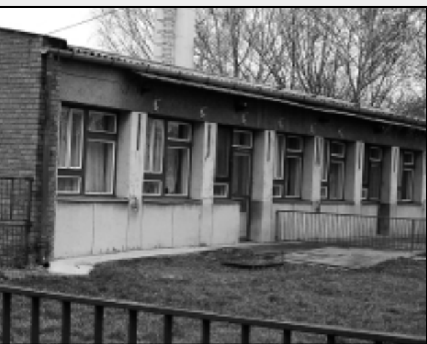
A VÁROSI BÖLCSŐDE ÉPÜLETE MA