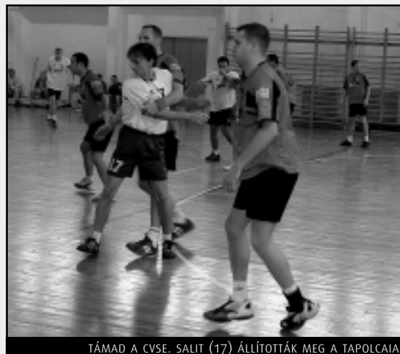
TÁMAD A CVSE. SALIT (17) ÁLLÍTOTTAK MEG A TAPOLCAIAK