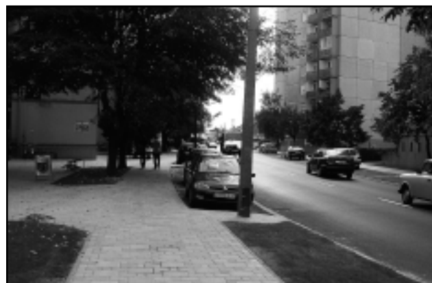
A SÁGI ÚT ÚJABB SZAKASZA LETT SZEBB ÉS JOBB

A környékbeli lakók gyűrűjében ezután átvágták a nemzetiszínű szalagot, amivel jelképesen átadták a forgalomnak a felújított közutat, járdákat és mintegy harminc parkolót. Ezután nemcsak kényelmesebben közlekedhetünk, hanem a szebbé is vált környezetünk egy újabb részlete.