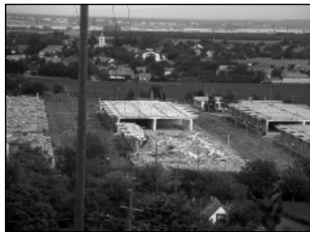
SORRA BONTOTTÁK LE A TARTALÉKGAZDÁLKODÁS EGYKORI RAKTÁRÉPÜLETEIT

mok lebontására lehetett pénzt nyerni. Az állam ezt a raktártelepet mindenképpen eladta volna. Ha egy magánvállalkozó vette volna meg, valószínűleg raktárnak használták volna az objektumot, és a természetvédelmi területen, a Ság hegy lábánál, nem messze a Vulkan fürdőtől megnövekedett volna a kamionforgalom. A raktártelepet 20 millió forintért vásárolta meg az önkormányzat, tavaly decemberben birtokba is vette a város. Időlegesen használatba visszaadták a Tartalékgazdálkodási Kht-nak, a megegyezés szerint idén tavaszig kellett a korábbi tulajdonosnak kifizetni a gabonát. Most pedig a raktárak bontása zajlik, a munkálatokat a Colas Kft. végzi. A bontási törmelék egy részét újra felhasználják, más részét válogatva hulladéklerakóba viszik. A bontást végző cég a munkálatok befejeztével a telep melletti utat is rendbe teszi.