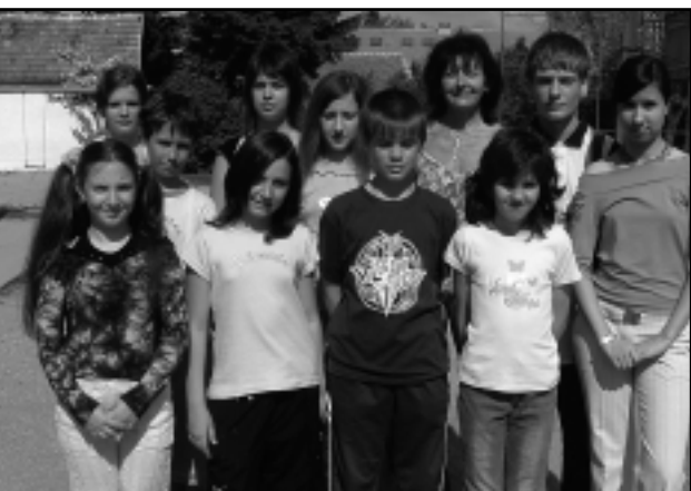
A TÜCSÖK BÁBCSOPORT ORSZÁGOS HARMADIK HELYEZETT LETT