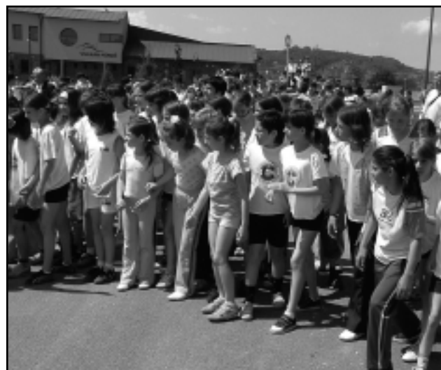
RAJT ELŐTT A FUTÓK EGYIK CSOPORTJA

A jánosvári Batthyány Lajos Általános iskola május végén rendezte meg a hagyományá vált kispályás labdarúgótornát, a Batthyány-kupát. A rendezvényen hat iskola – a jánosvári Batthyány és Szent Imre iskolák, a bobai, a hosszúperesztegi, az alsósági és az egyházashetyei iskolák – diákjai három korcsoportban mérköztek egymással.