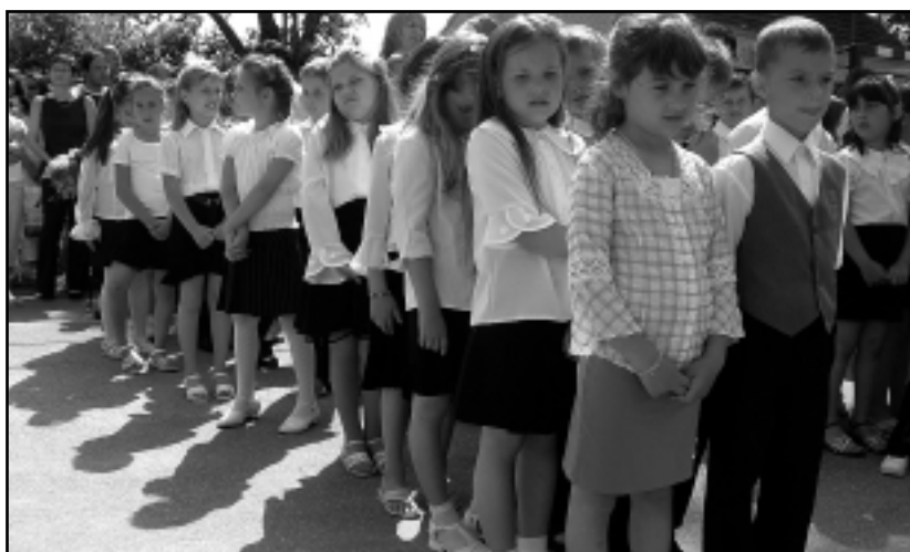
BIZONYÍTVÁNYOSZTÁS ELŐTT A KISDIÁKOK