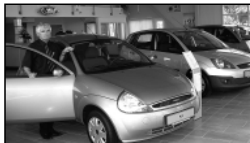
A FORD-SZALONBAN ÚJ AUTÓK FORGALMAZÁSÁVAL IS FOGLALKOZNAK

Az ügyvezető elmondta, hogy teljes körű szolgáltatást végeznek. Új és használt autót értékesítenek, segítenek a hitelügyintézésben, szerződésük van a biztosítótársaságokkal. Garanciális szervizt, javítást, eredetvizsgálatot is végeznek. A szervizmunkákhoz új műhelyt alakítottak ki komplett diagnosztikai sorral, teljes új berendezéssel, de nem kellett külön karosszériaműhelyt és fényező műhelyt létrehozni.