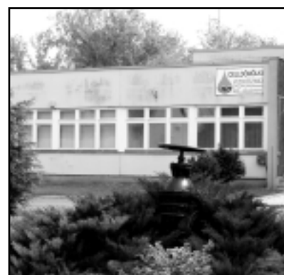
A CELLVÍZ KFT. TELEPHELYE A VÁROS SZÉLÉN

A testületi ülésen elhangzott: felügyelő bizottsági és a könyvvizsgálói eljárások hivatottak tisztázni, hogy ki tartozik felelősséggel. Az önkormányzat április elején hűtlen kezelés miatt rendőrségi feljelentést is tett a cég előző ügyvezetése ellen. Közben, márciustól ugyanis új ügyvezetője lett a