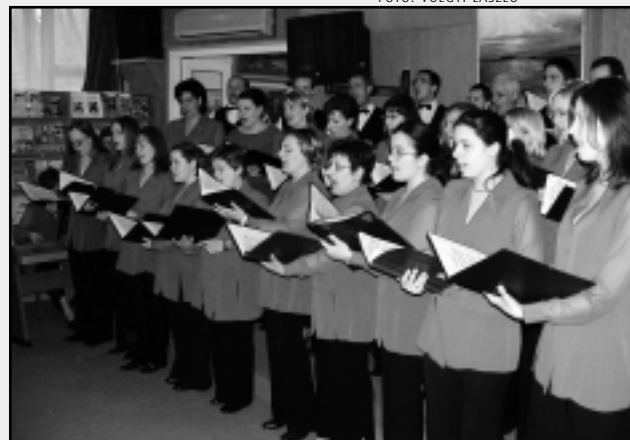
A NEGYVENÉVES LISZT FERENC VEGYESKAR