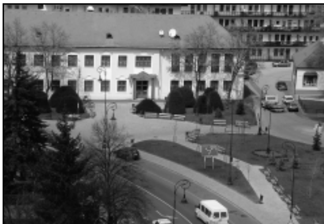
A VÁROSKÖZPONT ÉPÜLETEI MELLÉ ÉPÍTIK AZ ÚJ VÁROSHÁZÁT