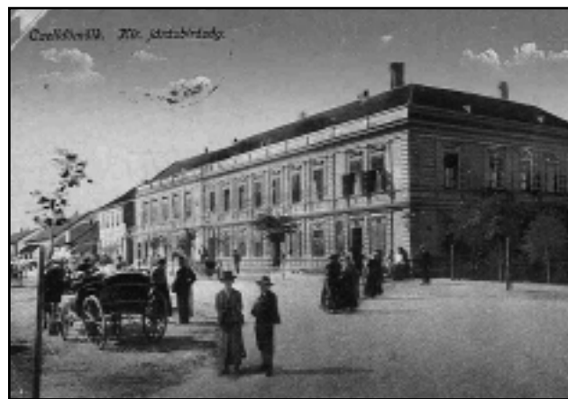
A SÁGI UTCA KÉPE A KORÁBBI IDŐKBŐL