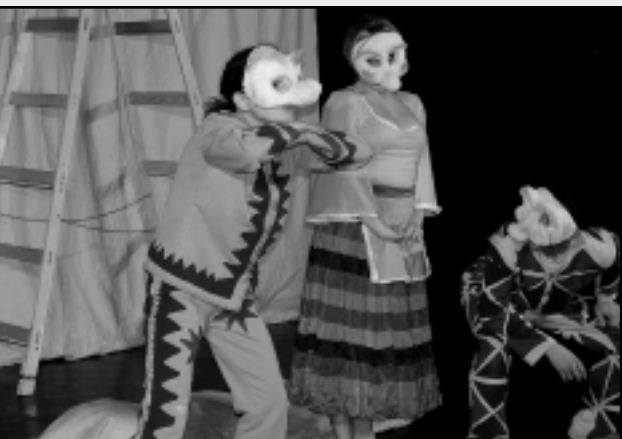
OLASZ VÍGJÁTÉKOT MUTATOTT BE A SOLTIS TÁRSULATA