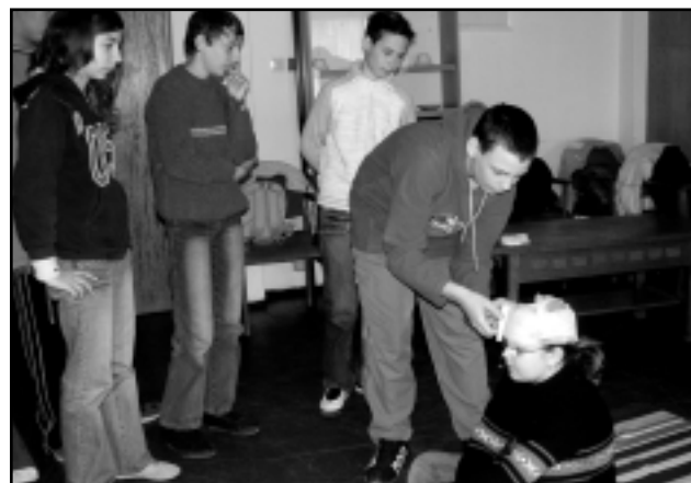
A DIÁKOK SZAKAVATOTT KEZEKKEL LÁTTÁK EL A SÉRÜLÉSEKET

során három helyszínen bizonyították rátermettségüket a fiatalok. A szimulációs gyakorlatokban egyebek mellett eszméletlen betegről kellett gondoskodniuk, vérző fület, lábtörést, nyitott hasi sérülést kellett ellátniuk. Bemutatták, hogyan kell befúvásos lélegeztetést alkalmazni, beteget hordágyra helyezni, gondoskodta az ál-sérültekről. A zsűri tagjai kérdésekkel segítették a bizonytalanabbakat, így a gyerekeknek könnyebben eszükbe jutottak a tanultak. A verseny végén a három celldömölki, a jánosházi és a kenyeri iskola diákjai egy újabb totót töltöttek ki, amelyben a vöröskeresztes ismeretekre kérdeztek rá. A megmérettetésen az Eötvös Loránd Általános Iskola csapata szerepelt a legeredményesebben, második lett a Gáyer Gyula Általános Iskola csapata, a harmadik helyen pedig a kenyeri Fekete István Általános Iskola diákjai végeztek. Az első-