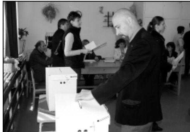
CELLDÖMÖLKÖN CSAK AZ ELSŐ FORDULÓBAN VOKSOLTUNK

Megalakulhat a második Gyurcsány-kormány. Április 23-án, a 2006-os országgyűlési választások második fordulójában Celldömölkön már nem szavaztunk, az ország 110 egyéni választókerületében azonban urnához járultak a szavazópolgárok. A második választási fordulóban kevesebben mentek el szavazni, mint az első fordulóban, április 9-én. 64,36 százalékos volt vasárnap a részvétel, az ekkor választásra jogosult 4 millió 975 ezer 327 választópolgárból 3 millió 202 ezer 954-en adták le voksukat. A szavazás eredményeképpen a Magyar Szocialista Párt 186 mandátumot, a Szabad Demokraták Szövetsége 18 képviselői helyet, a két párt közös jelöltjei további hat helyet kapnak az új parlamentben, így együttesen 210 fős többséget alkotnak. A Fidesz-KDNP 164, a Magyar Demokrata Fórum 11 mandátumot szerzett, és egy független jelölt is képviselői helyhez jutott. Az eredmény egyelőre nem hivatalos, csak tájékoztató adatokat közöl az Országos Választási Bizottság, mivel a hét végéig várni kell a külképviseleteken és a választókerületenként egy-egy szavazókörben leadott voksok összeszámlálására. A feldolgozottság így 98,38 százalék. Az azonban bizonyos, hogy a még meg nem számlált voksok számát tekintve az eredmény jelentősen már nem változik, csak némileg módosulhat. A kérdés már csak az, hogy a szocialista párt abszolút