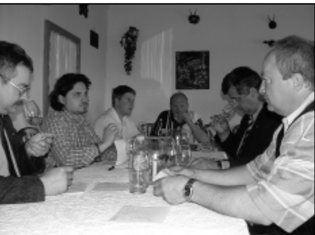
SAKEMBÉREK MINŐSÍTETTÉK A VERSENYZŐ BOROKAT