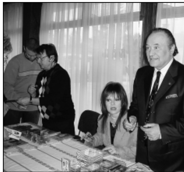
A KONCERT UTÁN DEDIKÁLTAK A FELLÉPŐ MŰVÉSZEK

A keddi délutánon jól ismert melódiák csendültek fel a népszerű énekesek előadásában, amelyeket természetesen a közönség is előszeretettel dalolt. Az előadás után a művészek lehetőséget biztosítottak a jelenlevők számára beszélgetésre és dedikálásra. A Tisztelet Társasága tevékenységei közé tartozik, hogy a koncertsorozat állomásain, a helyi, idősökkel foglalkozó intézménynek ajándékot adnak. Így a celli Idősök Otthona egy mikrohullámú sütővel gazdagodha-