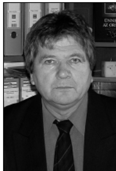
SZABÓ FERENC POLGÁRMESTER

- Ahhoz, hogy településünk lakosainak száma nőjön, egy 1998-ban elindított programmal magunk is hozzájárultunk, ez az ingyenes telek-program volt. Mindenképpen az volt a célunk, hogy minél több fiatal települjön be, öneik pedig a lehető legtöbb kedvezményt meg kell adnunk. Sajnos a törvényi szabályozások ezt az igyekezetünket megnehezítik. Megtörtént már a további telkek kialakítása, szeretnénk ezeket már közművesítetten átadni. Így a kezdeti nehézségeken is szeretnénk átsegíteni a nálunk letelepedni vágyó fiatalokat. A település érdekein kívül személyes indíttatás is vezetett: én nem itt születtem, de itt élek, és szeretném, ha idős napjaimra fiatalok vennének majd körül, gyermekzsivajtól lenne hangos a község. Próbálunk sorházépítésbe is kezdeni, ahol elgondolásaink szerint igen kedvező árat tudnánk kialakítani, sajnos azonban telekvásárlási kísérleteink nem mindig sikeresek.