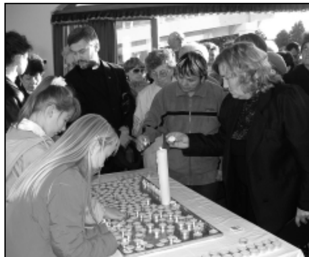
A RAVATALOZÓ ÁTADÁSÁN GYERTYÁK GYÚLTAL A HOLTAK EMLÉKÉRE