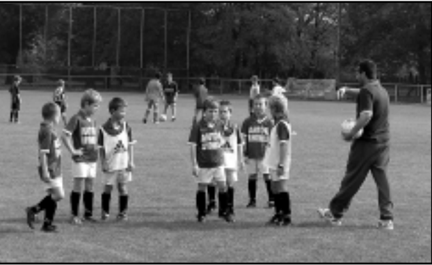
A CELLDÖMÖLKI SPORTTELEPEN RENDEZTEK VÁLOGATÁST A GYEREKEKNEK

Az öt alközpontból – Szentgotthárd, Kőrmend, Szombathely, Sárvár, Celldömölk – három korosztály 150 focistapalántájának részvételével rendezték meg a CVSE sporttelepén október