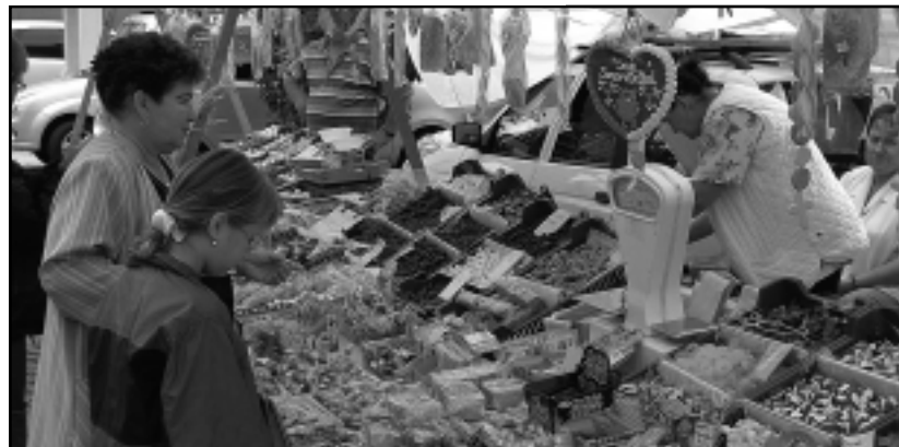
MÉZESKALÁCS SZÍVET KÍNÁLTAK VÁSÁRFIAKÉNT