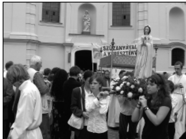
ÜNNEPI KÖRMENETEN A BÚCSÚ ALKALMÁBÓL