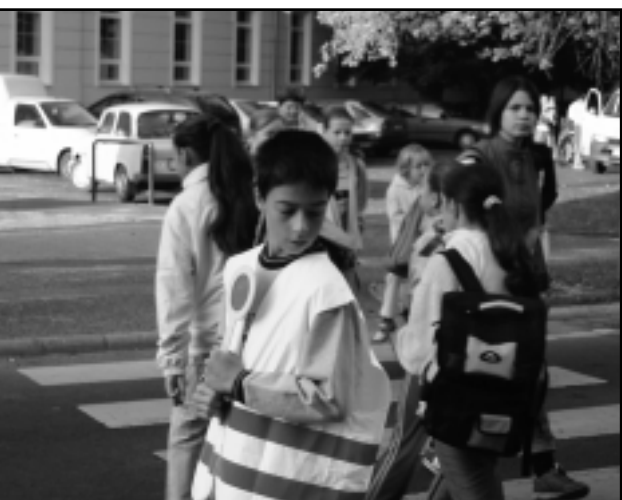
DIÁKOK SEGÍTIK A RENDŐRÖK MUNKÁJÁT REGGELENTE AZ ISKOLÁKNÁL

Aki hétköznap reggelente 7 óra 10 és fél nyolc között a Széchenyi úton közlekedik, egyruhába öltözött gyerekekkel találkozhat a zebrán. Ők a Gáyer Gyula Általános Iskola 7. osztályos tanulói, akik a rendőrök munkáját segítik. A KRESZ értelmében jelzőőri feladatot látnak el a neonzöld mellénybe öltözött, és jelzőtárcsát kezükben tartó diákok. Tevékenység-