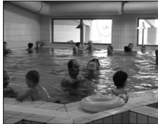
AZ ÜLŐMEDENCE BENTI, KINTI RÉSSZEL A FÜRDOZŐK KEDVENCE

A fürdőben elektronikus beléptető rendszer működik, a recepciós pultnál töltik fel a karórához hasonló chippet, amely a fürdő területére való belépésre jogosít. Az alapbelépő a három beltéri és az udvari medence használatára jogosít, külön kell belépőt váltani a jakuzzihoz és a szaunába. A 25 méteres, hatsávós úszómedence vízilabdamerkőzések lebonyolítására is alkalmas. Az úszómedence és a 130 négyzetméteres tanmedence vize nem termál, a tanmedencében élményelemek is vannak. A meleg vizes ülőmedence 36-37 fokos termálvízzel töltött, a víz felszíne 160 négyzetméter, amelynek mintegy fele az épületen kívül található. Az 55 négyzetméteres jakuzzi medence vize 32-33 fokos, időszakosan működő ülő- és fekvőmasszírozó, váll- és nyakzuhany adja az élmény jelleget. A kinti csúszdamedence 123 négyzetméteres, 16 éves korig használható, a vize 28-30 fokos. A fürdőépítés második ütemében, a nyári üzemzáródásig jövő nyárig szeretnék átadni a 113 négyzetméteres bébi-pancsolót és a 623 négyzetméteres élménymedencét. A fürdőben két finn jellegű szauna van, amelyekhez egy hideg vizes merülő medence tartozik. Később gőzkabin is üzemel majd. A gyógyászati részben – amelyet vállalkozásba szeretne kiadni a fenntartó – két kádfürdő, egy súlyfürdőmedence, iszapkezelő, víz alatti masszázskádak, masszázs, orvosi rendelők biztosítják a gyógyulást.