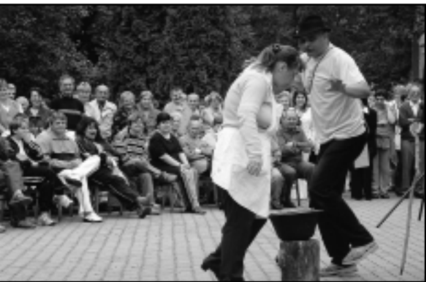
KULTURÁLIS ELŐADÁSOKKAL MUTAKOZTAK BE AZ INTÉZMÉNYEKBEK ENELLÁTOTTAK

Hetedik alkalommal rendezték meg Intaházán a pszichiátriai és szenvedélybetegek sport és kulturális találkozóját szeptember 15-én. A szakemberek szerint a program a rehabilitációt is szolgálja.