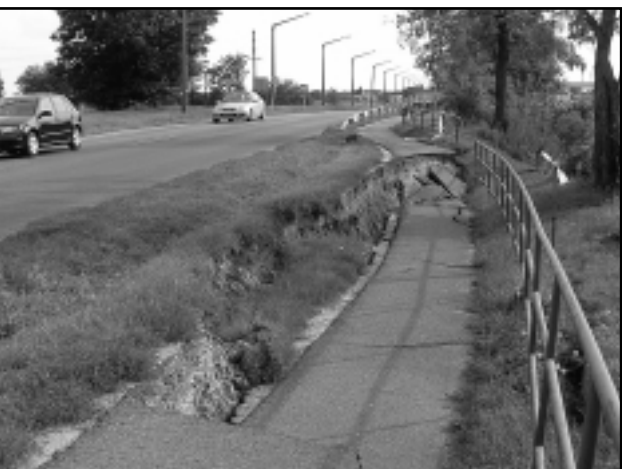
AZ ESŐZÉSEK MIATT LESZAKADT A KERÉKPÁRÚT EGY RÉSZÉ