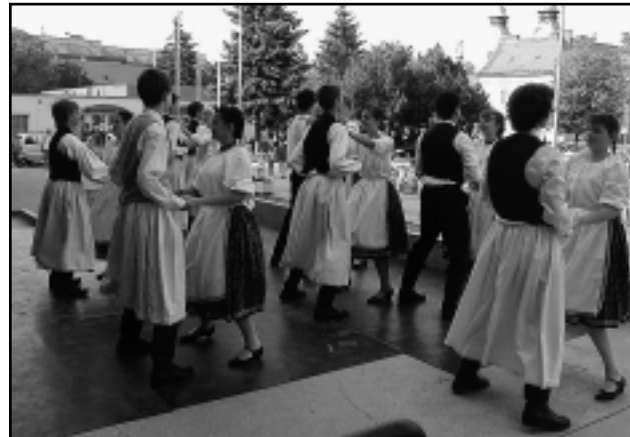
TÜZES TÁNCOK A NÉPTÁNCOSOKTÓL

Szent Iván-napját ünnepelték a városközpontban június 25-én. A rendezvény mottója a „fűben, fában, tűz lángjában, orvosság van szív bajára” volt. Ennek jegyében mutatkozott be