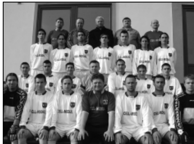
A CVSE-CELLMODUL CSAPATA

A csapat jó szereplésének fontos feltétele volt, hogy az egyesület vezetősége, a szponzorok és az önkormányzat megteremtették a szükséges anyagiakat, biztosította a kulturált körülményeket, melyet köszönünk. Jó játékkal igyekszünk meghálálni, akárcsak a Baráti Kör és szurkolóink támogatását, mérkőzéseken való buzdítá-