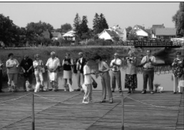
A VERSENY EREDMÉNYHIRDETÉSÉN