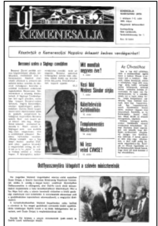
AZ ÚJ KEMENESALJA ELSŐ ÉS 400. LAPSZÁMÁNAK CÍMLAPJAI