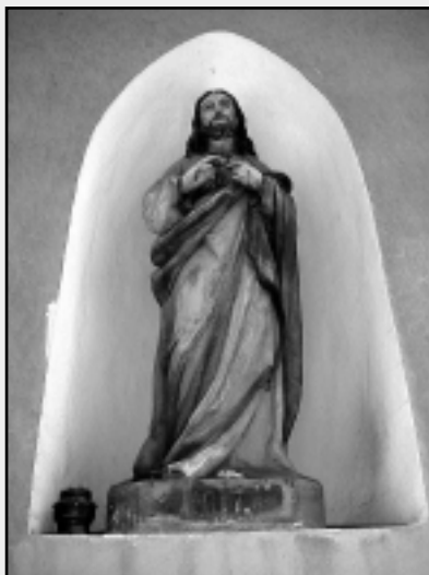
A FIZIKAVERSENY DÍSZVENDÉGEI

Margit látomása alapján a megnyitott és lángoló szívből kinövő kereszt a szeretetből vállalt halál jelképe. 1765-től 13. Kelemen, később 13. Leó, 9. Piusz és 11. Piusz pápa a Jézus szíve ünnepét az egész katolikus egyházra kiterjesztette. A Krisztus követése és az egyén felajánlása azt jelenti: egyesülni akarás a szeretettel. Fő ünnep a pünkösöd utáni második vasárnapot követő péntek, ilyenkor körmeneteket szoktak tartani. Az országban számos intézmény, szervezet viseli nevében a Jézus szíve szimbólumot, megyénkben például Kőszegen és Zombathelyen. A szobor talapzatán az 1917-es év szerepel. Ekkor Hollósi Rupert a dömölki apát, Kühár Flóris hittudós a plébános. Utóbbiról írja Nemes Vazul a Mária Kongregációban, hogy évről évre új és új lilimos csapatot avat a Szűzanya erényeinek követésére.