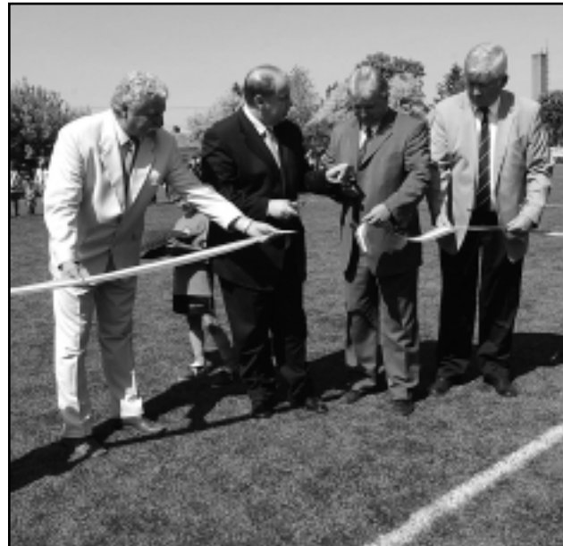
A MEGYE ELSŐ MŰFÜVES PÁLYÁJÁT AVATTÁK FEL

Kiss Péter miniszter avatóbeszédében az új játéktéren felsorakozó Ferencváros és CVSE öregfiúk csapatainak játékosait hozta példaképnek, de hangsúlyozta, nem kell mindenkinek híres labdarúgónak lenni, a fontos hogy sportot szerető emberek legyenek. Szolt arról is, hogy jelentős beruházások folynak a megyében, amelynek része az európai színvonalú műfüves pálya. Az országban 57 településen hoztak létre műfüves pályát a program keretében. „Az országnak szüksége van arra, hogy sok lépést tegyünk meg együtt ahhoz, hogy megépíthessük, amit szeretnénk, amit nyugat-európai országokban látunk, de nálunk még hiányzik”, mondta a kancelláriaminiszter.