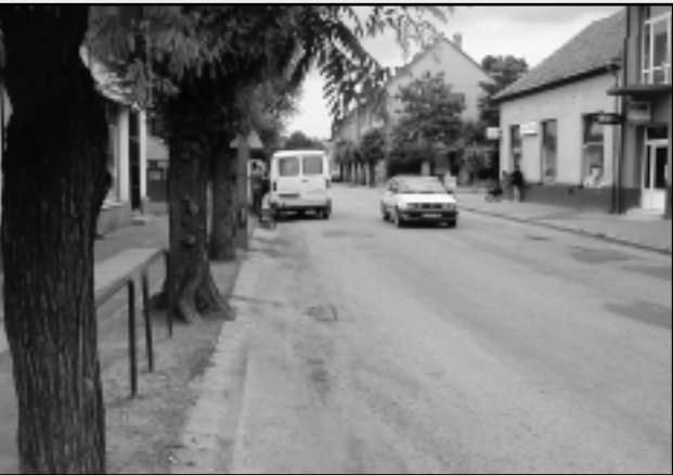
A KOSSUTH UTCÁT ÚJRA ASZFALTOZZÁK

tokhoz vezető utak felújítására. Celldömölk környékén 26 kilométer alsóbbrendű utat újítanak fel: Celldömölk és Jánosháza között 16 kilométernyi, a megyehatár és Boba között 4 kilométernyi, Mesteri és Cell között 5,4 kilométernyi út újul meg. A száz-