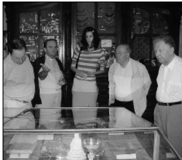
A FRANCIA KÜLDÖTTÉG MEGNÉZTE A TEMPLOMI KINCSTÁRAT IS

Francois Longchambon polgármester a rövid látogatás után úgy nyilatkozott: kellemes kisvárosnak ismerték meg Celldömöket, amelynek van történelme, ugyanakkor újítások, fejlesztések is folyamatban vannak. Saját városáról is beszélt a polgármester, aki szintén a Francia Becsületrend lovagja. Montmorency, mint a nevében is benne van, hegyoldalon fekvő település, szinte kertvárosa Franciaország fővárosá-