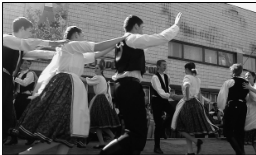
TÁNCVARÁZS A SZABADTÉRI SZÍNPADON