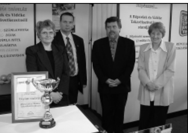
A VÁSÁRI NAGYDÍJAT A RÉPCELAKI TAKARÉKSZÖVETKEZET KAPTA