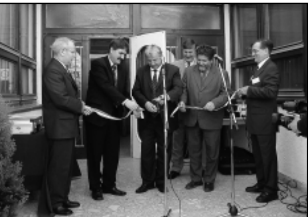
HETEDIK ALKALOMMAL NYÍLT MEG A VÁSÁR

Hetedik alkalommal rendezték meg a Kemenesalja Expót. A kiállításon és vásáron szakmai programok is várták az érdeklődőket.