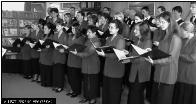
A LISZT FERENC VEGYESKAR