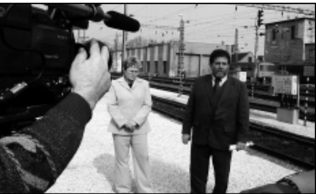
A VASÚTÁLLOMÁSON TARTOTTAK SAJTÓTÁJÉKOZTATÓT

deszes országgyűlési képviselők április 14-én a vasútállomáson.