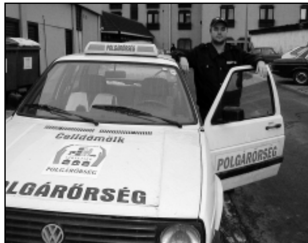
ÖNÁLLÓ GÉPKOCSIT KAPOTT A CELLDÖMÖLKI CSOPORT

A polgárőrök társadalmi munkában látják el a munkájukat. A működésükre, például a szolgálati gépkocsira, amelyet a tavalyi kiváló munkájukért kaptak az Országos Rendőr-főkapitányságtól – tankolására támogatóiktól kapnak pénzt, de anyagiakban bizony szűkösen vannak. Mindezek ellenére nem kell toborozni a tagokat,