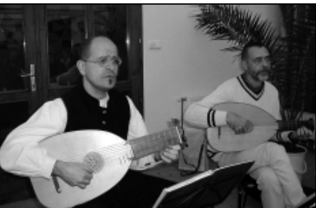
KORABELI HANGSZEREKKEL LÉPTEK FEL A ZENÉSZEK

Az irodahelyiség hétfőn 8-10, 14-16 óra között, szerdán 14-16 óra között, pénteken 8-10, 14-16 óra között tart nyitva.