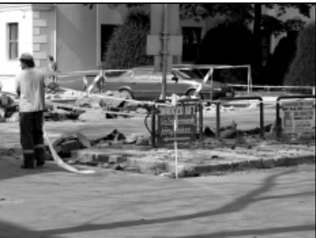
ÁTÉPÍTIK A BELVÁROST