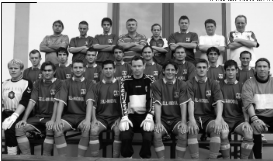
A CVSE-CELL-MODUL CSAPATA