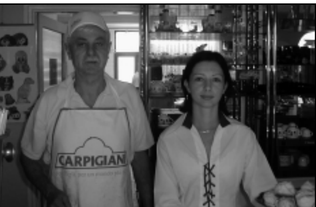
A CUKRÁSZ ÉS TANÍTVÁNYA