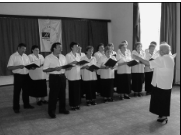
A BOBAI DALOSKÖR IS FELLÉPETT EGYHÁZASHETYÉN