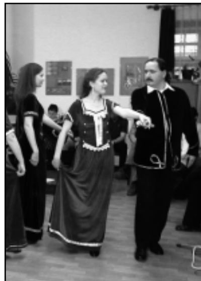
RENEZÁNSZ ZENE, RENESZÁNSZ TÁNC

A műsort reneszánsz dalok és a Kemenesalja Néptáncegyüttes tagjai által előadott XVI. századi francia táncok és egy XVII. századi hajdútánc színesítette. A hangverseny után reneszánsz táncból keretében régi táncokat tanulhattak az érdeklődők. A ka-