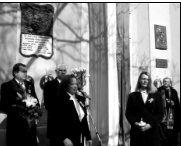
A POLGÁRMESTERI HIVATAL FALÁN A HŐSÖK EMLÉKMŰVE