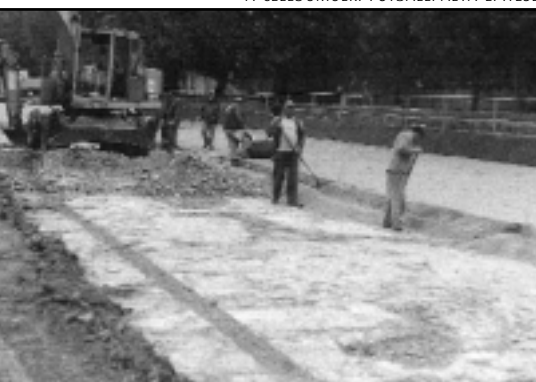
A CELLDÖMÖLKI FUTBALLPÁLYA ÉPÍTÉSE