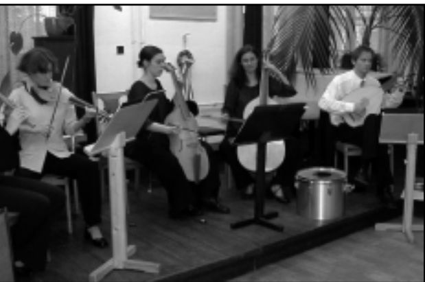
AZ ÓMUZSIKA EGYÜTTES ZENÉLT

A reneszánsz időszaka egyfajta újjászületés az emberiség történetében, mikor a túlvilági életre való felkészülés helyett a földön találta meg az élet valódi értelmét. Teret kapott a tudomány, a művészet, az építészet fejlődése, az uralkodók és a mecénás főurak udvaraiban több tudós és művész vendégeskedett, tartózkodása idején csodálatos dolgokat alkotva. E kor zenéjéből és táncaiból kapott