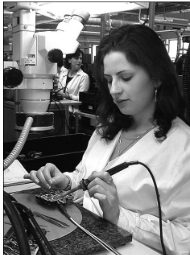
ÚJABB MUNKAERŐ-FELVÉTEL VÁRHATÓ

A tendencia folytatódik: új, 1100 négyzetméteres logisztika csarnok megépítést határozta el a cégvezetés. A termékpaletta is tovább bővül, így várható, hogy újabb munkáskézre lesz hamarosan szükség, ennek következtében várhatóan fel tudják oldani a jelenlegi inproductív munka-