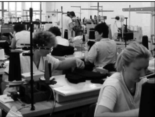
A CÉG DOLGOZÓINAK TÖBBSÉGE NŐ