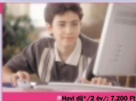
Havi díj* /2 év/: 7.200 Ft

Letöltési sebesség: 384 Kbit/s Feltöltési sebesség: 128 Kbit/s Benne foglalt forgalom: 1.200 MB Benne foglalt forgalom felett: 20 Ft/MB Csatlakoztatható számítógépek száma: 1 E-mail cím : 3 db E-mail tárterület: 5 MB/db Fix IP cím: igényelhető www tárterület: 10 MB Bekapcsolás: 16.000 Ft Kábelmodem: 22.000 Ft