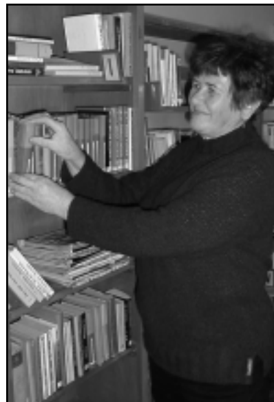
A VÁROSI KÖNYVTÁR FIÓKKÖNYVTÁRA AZ IZSÁKFAI

A fiókkönyvtárnak jelenleg 38 beiratkozott tagja van, fele-fele arányban iskolások és felnőttek. Minden pénteken 18