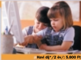
Havi díj* /2 év/: 5.800 Ft

Letöltési sebesség: 384 Kbit/s Feltöltési sebesség: 128 Kbit/s Benne foglalt forgalom: 400 MB Benne foglalt forgalom felett: 24 Ft/MB Csatlakoztatható számítógépek száma: 1 E-mail cím : 2 db E-mail tárterület: 5 MB/db Fix IP cím: igényelhető www tárterület: 5 MB Bekapcsolás: 16.000 Ft Kábelmodem: 22.000 Ft