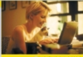
Havi díj* /2 év/: 2.000 Ft

Letöltési sebesség: 384 Kbit/s Feltöltési sebesség: 128 Kbit/s Benne foglalt forgalom: – Benne foglalt forgalom felett: 30 Ft/MB Csatlakoztatható számítógépek száma: 1 E-mail cím : 1 db E-mail tárterület: 5 MB/db Fix IP cím: – www tárterület: – Bekapcsolás: 16.000 Ft Kábelmodem: 22.000 Ft