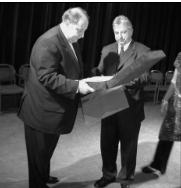
KISS PÉTER KANCELLÁRIAMINISZTER, DÍSZPOLGÁR