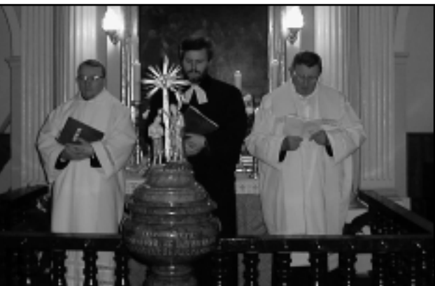
HÁROM EGYHÁZ KÉPVISELŐI AZ ÖKUMENIKUS IMAHÉTEN

„Az én békességemet adom nektek” (Jn 14,23-31) volt a jelmondata az idei ökumenikus imahétnek, amelyet január 18-a és 25-e között rendeztek. Az ökumenikus imahét minden évben új feladatot, de egyben új lehetőséget is jelent a városban élő, különböző felekezetekhez tartozó lelkészeknek. Hosszú évek együtt munkálkodásaként és a közös akarat megnyilvánulásaként ebben az évben minden nap más és más templomban, de minden lelkész részt vett az istentiszteleteken.