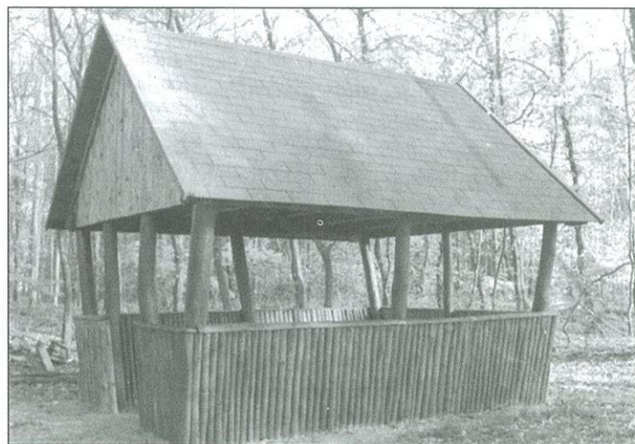
A parkerdőben felújították az esőbeállót is