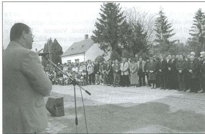
A székház átadása az ISM részéről