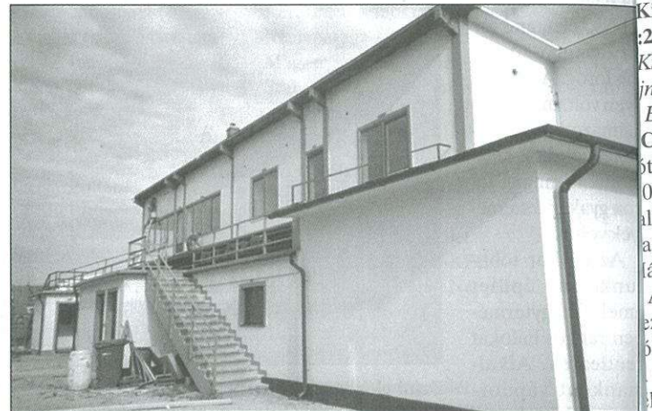
... és ilyen lett a tribün