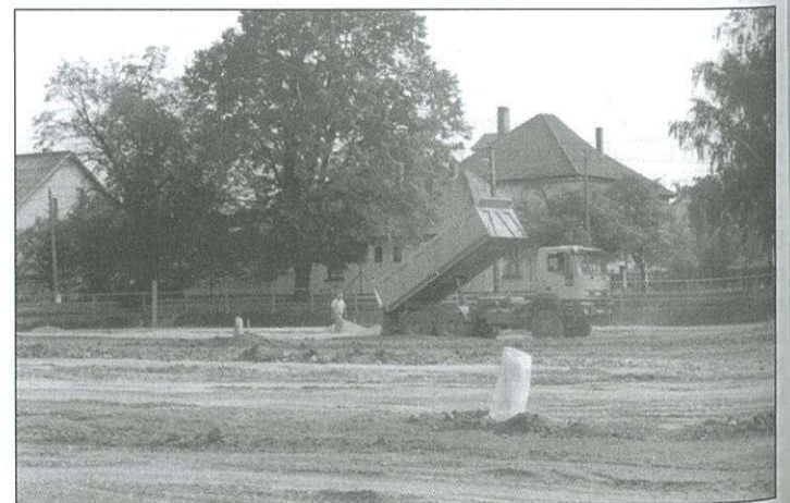
Munkában a pályaépítők