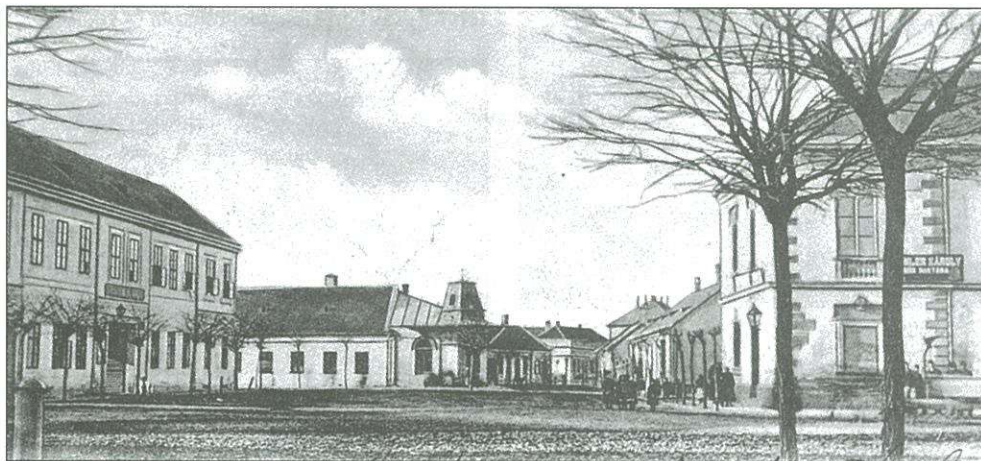
Színi előadásokat, istentiszteleteket is tartottak a Korona épületében

Földműves Szövetkezet kezelésébe, majd tulajdonába került. Évtizedek múlásával a benne folyó élet hanyatlani kezdett, maga az épület is enyészetnek indult. Voltak kísérletek a megmentésére, Ráday Mihály városvédő műsorában is szerepelt. Az idő megtette