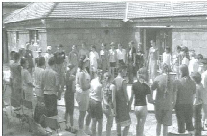
Délutánonként szabadidős foglalkozásokat szerveztek

tosításában fontos szerepet vállaltak a celldömölki vállalkozók és cégek is, akik nemcsak pénzzel, de ételmezzel, tejjel, egyéb tárgyi juttatással, vagy éppen fagyizással és süteményezéssel támogatták az erdélyi és kárpátaljai gyerekek magyarországi tartózkodását.