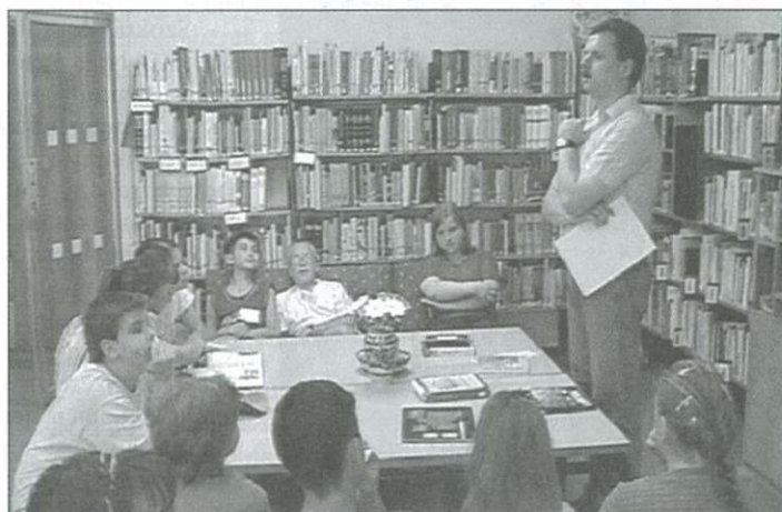
Rendhagyó tanórákon ismerkedtek a gyerekek a történelemmel

nek tudatosítása, megerősítése, a különböző kulturális háttérből érkező gyerekek közösséggé formálása volt. A napi foglalkozások mentálhigiénés szakember által vezetett szociometriai játékokkal kezdődtek, ezzel is próbálták a közösséggé formálódást elősegíteni. Rendhagyó földrajz-, történelem-, irodalomórákon ismerkedtek a gyerekek a XX. század