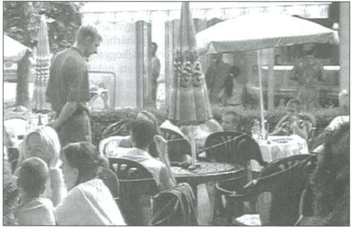
Új színpaddal gazdagodott a belváros