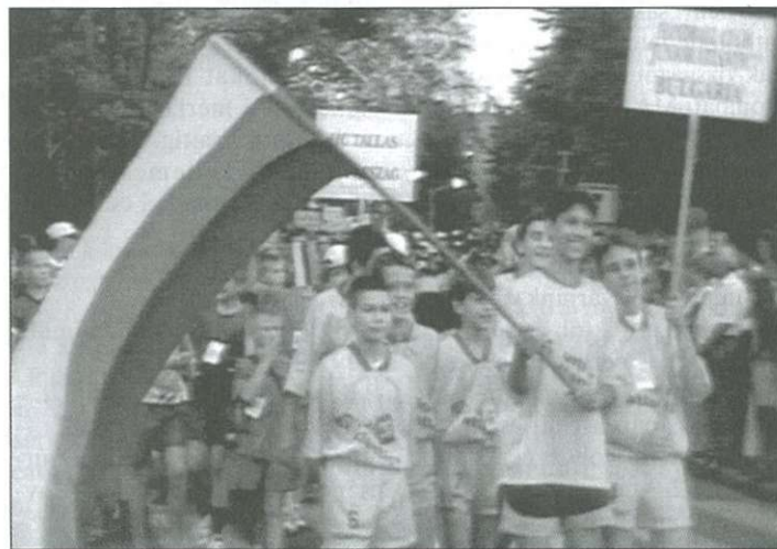
Tavalyi felvétel a sportolók felvonulásáról

A kézilabda-mérkőzéseket Celldömölkön, Sárváron, Ikerváron és Pápán játsszák a hazai és a külföldi csapatok. Városunkban köszönhetünk német, francia, lengyel, jugoszláv, bolgár sportolókat, és csapatok érkeznek Algériából, Nigériából és Tunéziából is. Természetesen a hazai klubok is képviselik magukat a fiatalabb korosztályú csapataikkal, így itt lesznek a Dunaferr, a Ferencváros, a Szeged és a Pécs ifjú kézilabda-játékosai is.