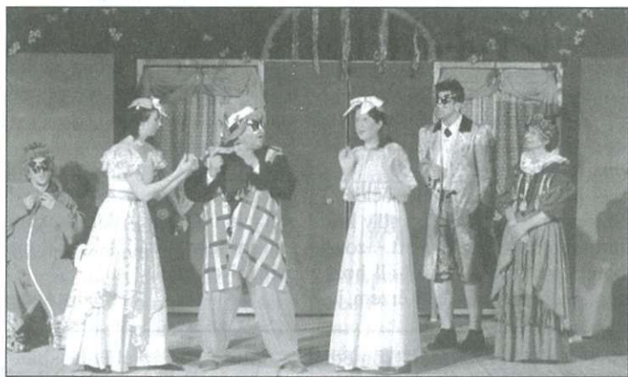
A Hamupipőke volt az idei egyik premierelőadás

A 2001-2002-es évad a 22. évad, amit huszonkét felnőtt, hét diák társulati taggal, tizenhárom diák- és hét gyerekstúdióssal jártak végig. A társulati tagok három bemutatóval készültek: a Vízkereszt, vagy amit akartok, a Csalogány és a Hamupipőke című darabban, a stúdiósok pedig a Leláncolt Prométheuszot adták elő. Nagy Gábor véleménye szerint kialakult az a szakmai vezetői gárda, amire számítani lehet a rendezés és a stúdió