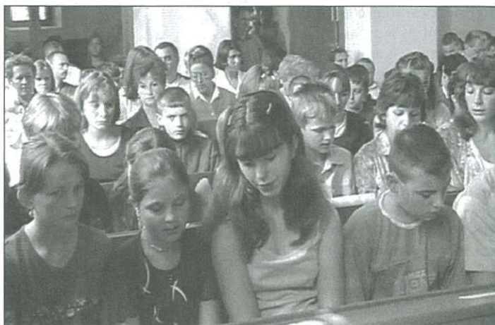
Erdélyből és Kárpátaljáról érkeztek Cellbe a gyerekek