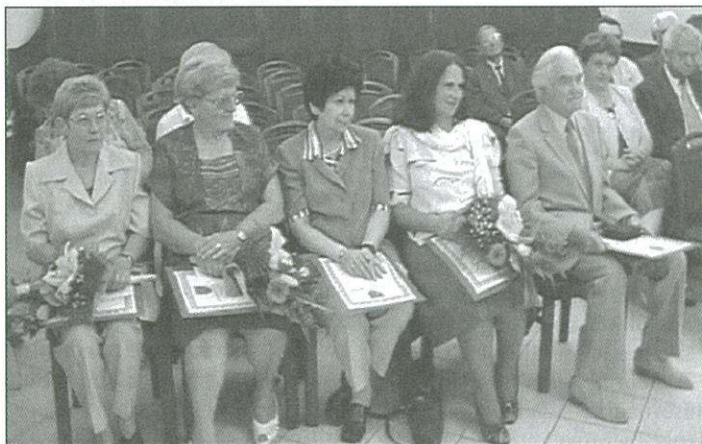
Az egészségügyi és szociális munkájukért kitüntetettek