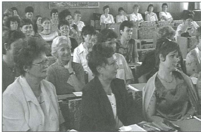
Bemutató tanításokon, óraelemzéseken a pedagógusok

gyerekek többsége szituatív módon tanul, azaz rákészsül a dolgotra, de a megtanult anyagot rövid időn belül el is felejt. A dyslexiáról és a hiperaktivitásról elmondta, hogy nem betegségek, hanem genetikailag meghatáro-