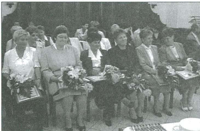
A kitüntetettek Celldömölk Városért Emléklapot kaptak