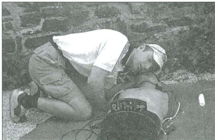
Akadályversenyen az elsősegélynyújtásról adtak számot