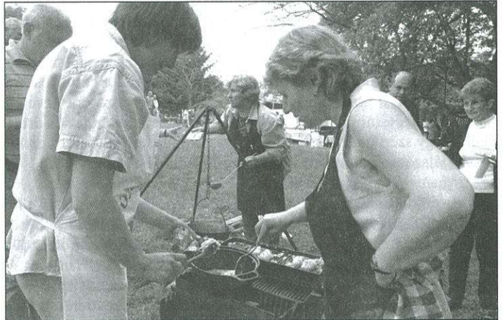
Róka-gombás őzpörköltet főzött a lelkes csapat

A Sok tál dödölle... főzőversenyen nem annyira különleges, mint inkább hagyományos ételek készültek, amelyeket Kudlik Júlia vezetésével szakmai zsűri bíralt. A híres tévészemélyiség elmondta, több új receptre is lett,