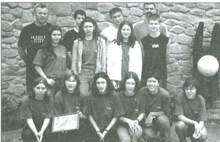
Két gimnazista csapat vett részt a kalandtúrán