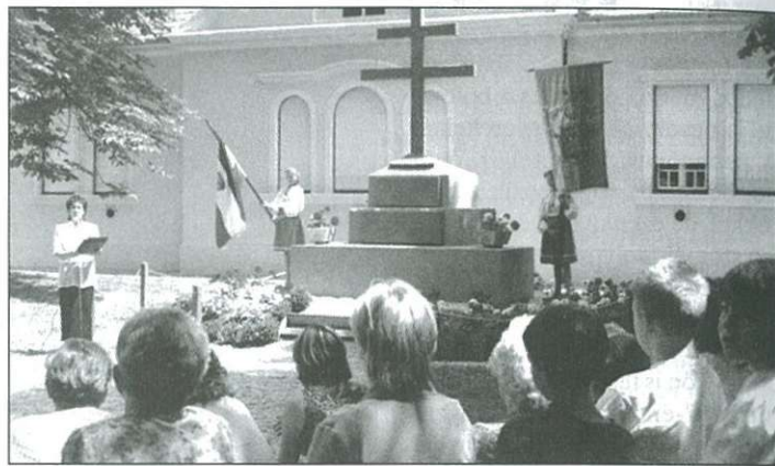
A gyászos békediktátumra emlékeztek Kemenesmagasiban