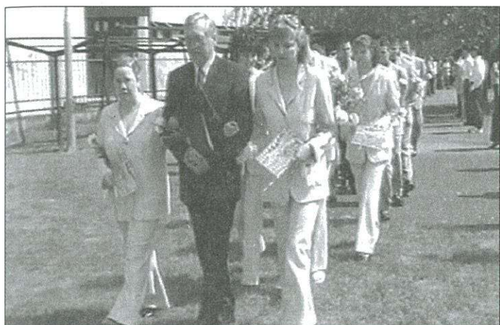
Százötvenhat végzős ballagott a hétfvégén városunkban

lában hetvenheten ballagtak. E hét elején a magyar nyelv és irodalom dolgozattal megkezdődtek az érettségi és a szakmunkás vizsgák.