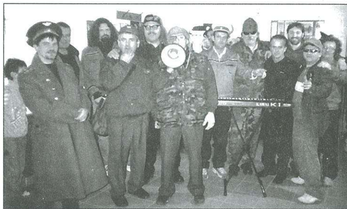
A postás a haverom klip felvétele Kenyeriben