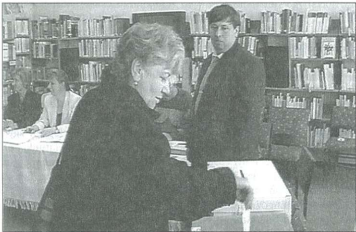
Több mint hétezeren szavaztak Celldömölkön

A szavazásra jogosult 9569 celldömölkiből több mint hétezeren adtak le érvényes szavazatokat. (További részleteket a következő lapszámunkban közlünk.)