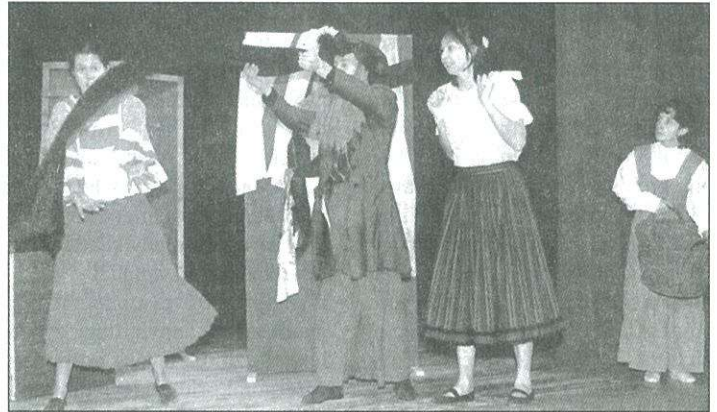
Bálba készül Hamupipóke a testvéreivel