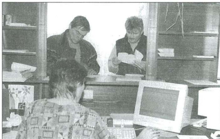
Több mint 12 ezer ügyben jártak el az elmúlt évben

– Hivatalunk illetékességi területe Celdömölkre és a városkörnyék 27 községére terjed ki. Alaptevékenységünk a földtulajdon, földhasználat, földvédelem, földértékelés és földminősítés, a földmérés és térképészet hatósági feladatainak végzése, valamint az ezekből fakadó és ezekhez kapcsolódó kiegészítő és kiegészítő jellegű szolgáltatási és egyéb hatósági feladatok ellátása. Illetékességi területünk mintegy 47 és fél ezer hek-