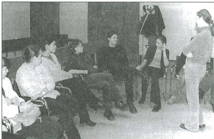
A Soltis színház stúdiójának segítségével rögtönzött szituációkat játszo- tak az ifjúsági klubban

Az összegyűltek kezdetben bá- tortalanok voltak, főleg a fiata-