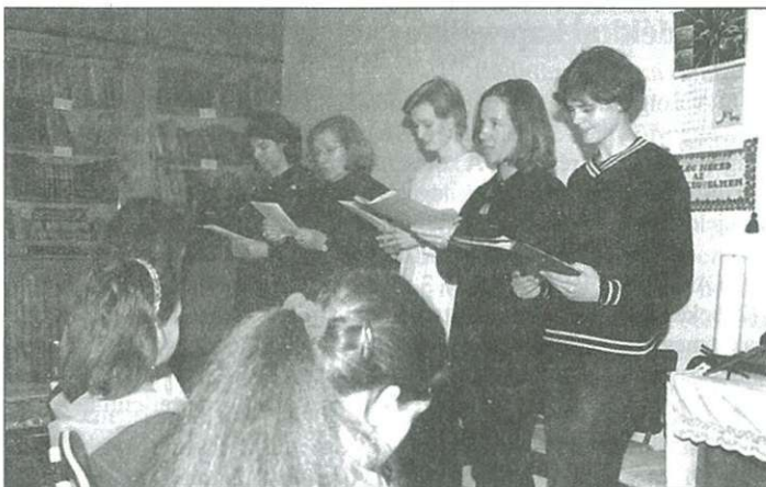
Ökumenikus imnapot tartottak az evangélikus gyülekezeti teremben

A lelkész diaképeket vetített Romániáról, illetve az ott élő asszonyok sorsáról. A román asszonyok által összeállított képsorból és szöveges anyagból kiderült: „Országukban a jogállam és a demokratikus elvek megvalósítása nehéz. Sok család szenved a munkanélküliség és a szegénység miatt. Rosszak a lakáskörülmények, télen sokan fagyoskodnak. Sok az elhagyott ember: gyermekek, akik az árvahá-