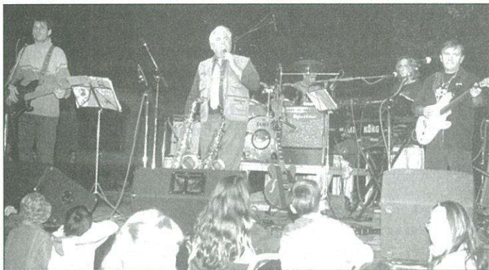
A szüreti mulatságon régi fényében ragyogott az alkalomra ismét összeállt Fény együttes