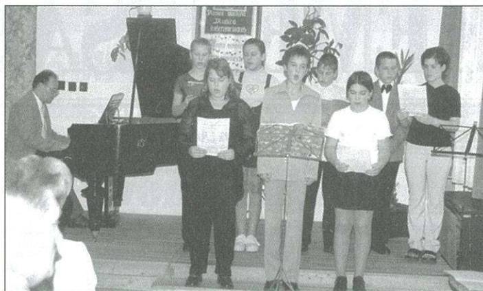
Az iskola növendékei a zenés köszöntőn

Az ünnepélyes megnyitó hangulatát a zeneiskola növendékeinek műsora varázsolta igazán ün-